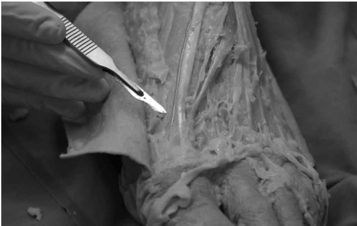
Figura 3. detalle de un EHC en pie adulto, señalado con línea.

Como hemos estudiado en la literatura, la presencia de EHC es menor en fetos que en adultos, y plantean todos los autores una razón: el uso de EHL en útero materno es práctica-