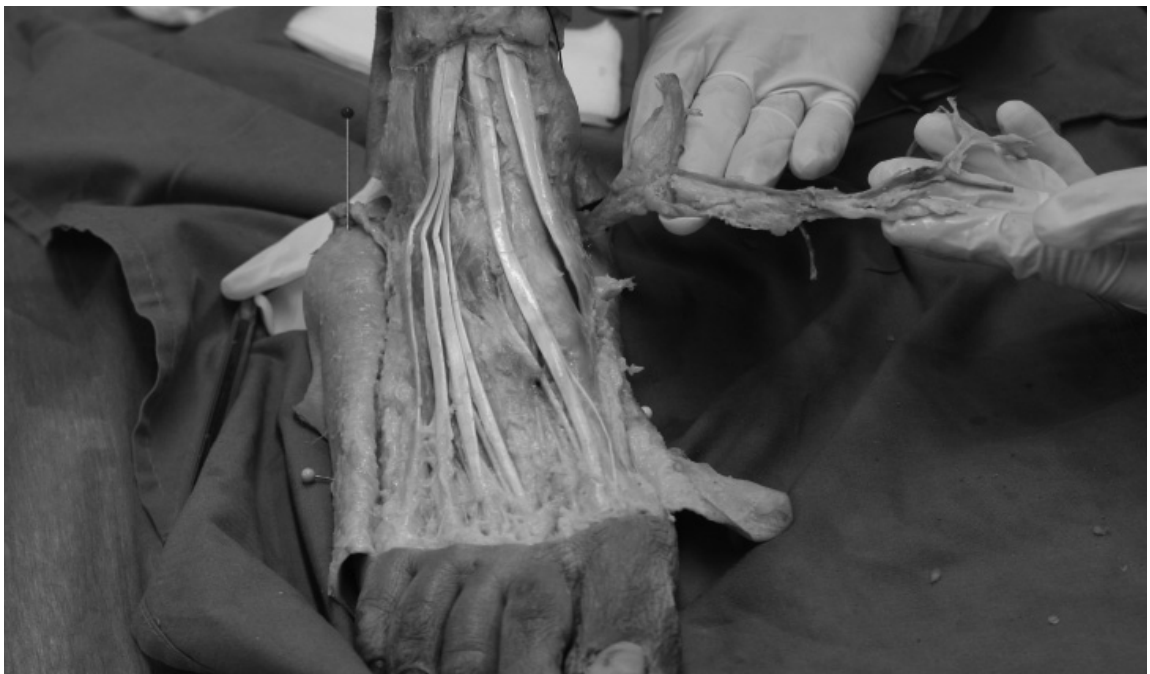
Figura 1. Detalle de la musculatura extensora a nivel del dorso del pie.

El músculo Extensor Hallucis Longus pertenece al grupo de músculos Regio Cruralis Anterior, es decir, región anterior de la pierna, que comprende cuatro músculos yuxtapuestos de medial a lateral en el orden siguiente: tibial