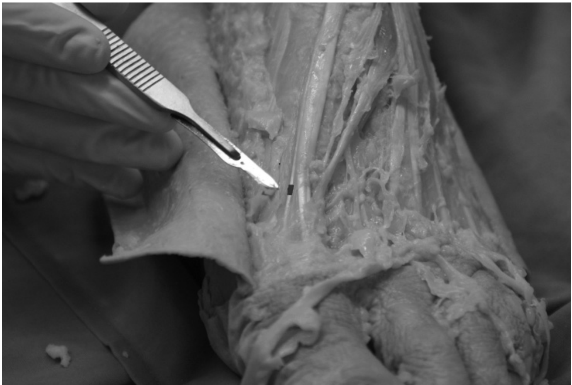
Figura 6. Medición de la anchura del EH capsularis, señalado con línea.