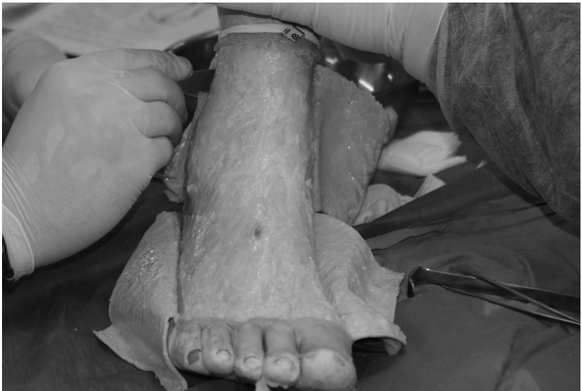
Figura 5. Disección dorsal de la garganta del pie.