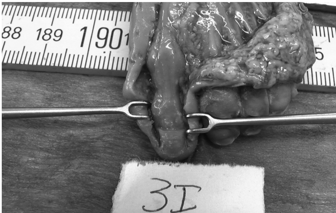
Figura 4. disección de feto. No se aprecia capsularis.