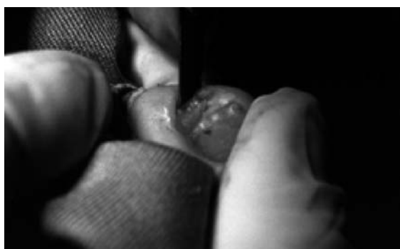
Figura 8. Incisión elíptica del fibroqueratoma.

Realizamos una incisión elíptica del fibroqueratoma periungueal adquirido y a continuación mediante disección roma a lo largo del tumor y en toda su periferia se aísla la lesión del tejido adyacente.