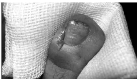
Figura 11. Detalle del dedo una vez aproximados los bordes quirúrgicos.