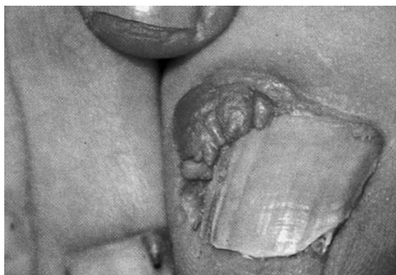
Figura 4. Tumores de Koënen en lateral del 1º y 3º dedo.