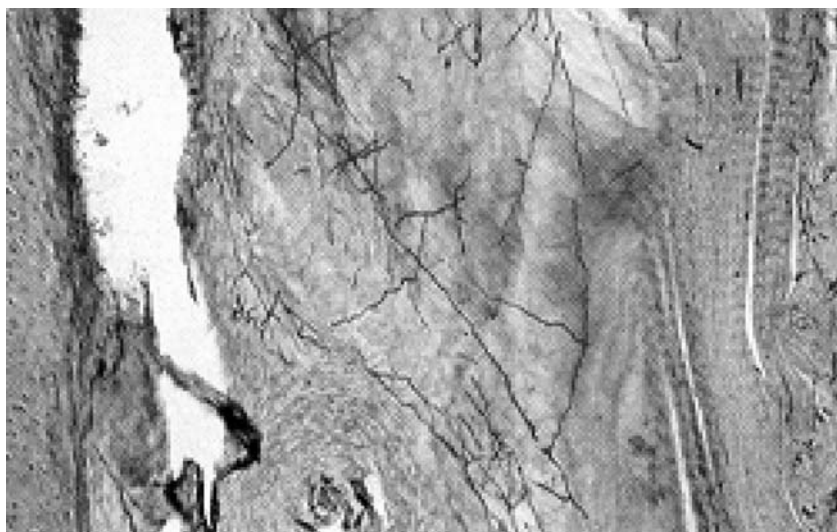
Figura 1. Microscopía de la biopsia.

Si no se encuentran comprimidos por las uñas, suelen tener forma pediculada y si crecen debajo de ella pueden tener un aspecto hiperqueratósico, similar a una verruga (Fig.2)