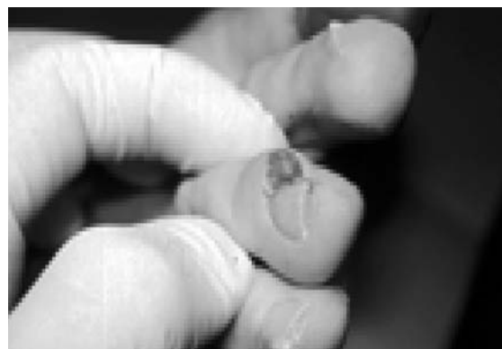
Figura 5. Fibroqueratoma Periungueal Adquirido en zona medial del tercer dedo.

Se efectúa la exéresis quirúrgica del fibroqueratoma periungueal adquirido del tercer dedo del pie derecho, localizado sobre el surco lateral interno, de 0,5 cm. de ancho por 0,6 de largo, en una paciente de 31 años de edad, sin antecedentes personales ni familiares de relevancia. (Fig.5 y Fig. 6)