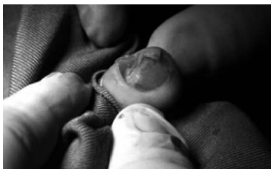
Figura 10. Aspecto efectuada la remodelación estética.

A continuación se efectúa la reconstrucción estética del canal tibial buscando la homogeneidad del mismo y de la placa ungueal, con ayuda de tiras de aproximación. Es importante evitar que quede tensión en la zona, que impida una correcta cicatrización. (Fig. 10, 11).