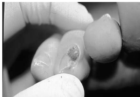
Figura 6. Otra visión del Fibroqueratoma Periungueal Adquirido en zona medial del tercer dedo.