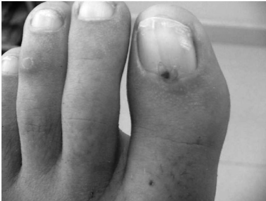
Figura 2. Fibroqueratoma Periungueal adquirido localizado en zona media de la región ungueal del primer dedo del pie izquierdo.

Los fibroqueratomas periungueales adquiridos, en general son asintomáticos, aunque si se localizan en zonas de presión pueden generar dolor y por compresión matricial la placa ungueal puede generar una fisura longitudinal.