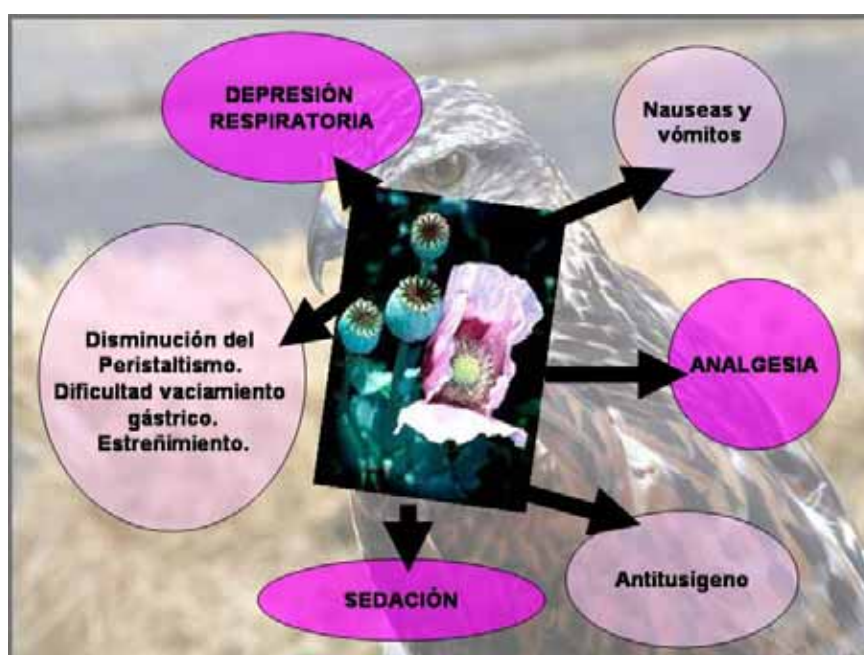
Figura I. Principales efectos originados por los fármacos opioides en mamíferos

En mamíferos, los opioides se caracterizan por producir acciones muy diversas tales como náuseas, vómitos, disminución del peristaltismo, dificultad para el vaciamiento gástrico, estreñimiento y efecto antitusígeno entre otros (Goodman and Gilman, 1996). En aves, además de el efecto analgésico, se ha descrito la presencia de sedación y depresión respiratoria (Machin, 2005).