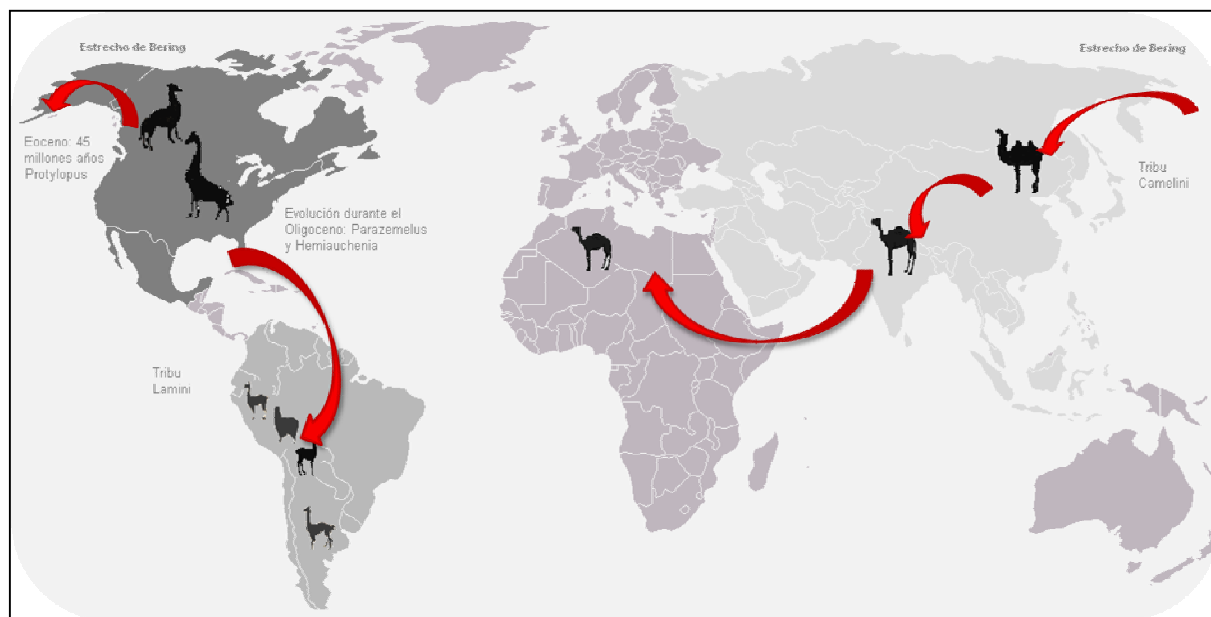
Figura 2. Origen los camélidos.