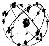
Figura 1.—Constelación NAVSTAR.

El Sistema de Posicionamiento Global 1 , GPS ( Global Positioning System ), es un sistema de navegación por radioondas que permite localizar cualquier punto de la superficie terrestre. Está basado en una constelación de 24 satélites, NAVSTAR (Fig. 1 y 2), y en cinco estaciones de seguimiento de los satélites. El GPS utiliza estos satélites como puntos de referencia con los que calcular, mediante equipos portátiles (Fig. 3), la posición con una precisión que puede llegar a ser milimétrica con los instrumentos y el tratamiento informático adecuados.