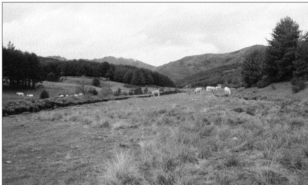
Figura 1. Pastizal de inundación en la cuenca del río Lillas.

un máximo en la Sierra de Ayllón; existe un periodo de actividad vegetativa muy corto, inferior a cinco meses, condicionado por las bajas temperaturas y en el Sistema Central se produce un aumento de la aridez estival de este a oeste debido a la influencia creciente en este mismo sentido del anticiclón de las Azores. La mínima aridez estival se presenta en el subsector Ayllonense.