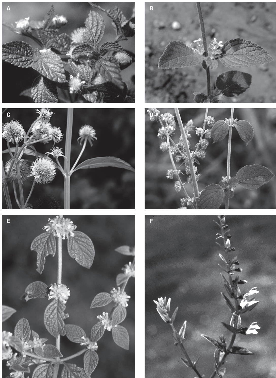
Fig. 3- Imágenes de alguna de las especies americanas tratadas. A: Hyptis atrorubens Poit. B: Hyptis suaveolens (L.) Poit. C: Hyptis savannarum Briq. D: Hyptis pectinata (L.) Poit. E: Minthostachys mollis (Kunth) Griseb. F: Scutellaria racemosa Pers. (Fotografías J. L. Fernández Alonso).