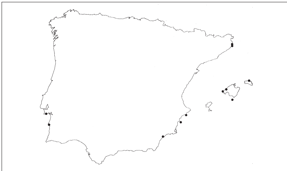
Mapa 2.—Distribución de Spatoglossum solieri en la Península Ibérica y las Islas Baleares.

Cabrera: 31SDD93 , illot Foradat, 29-V-1996, HGI/A 2913.