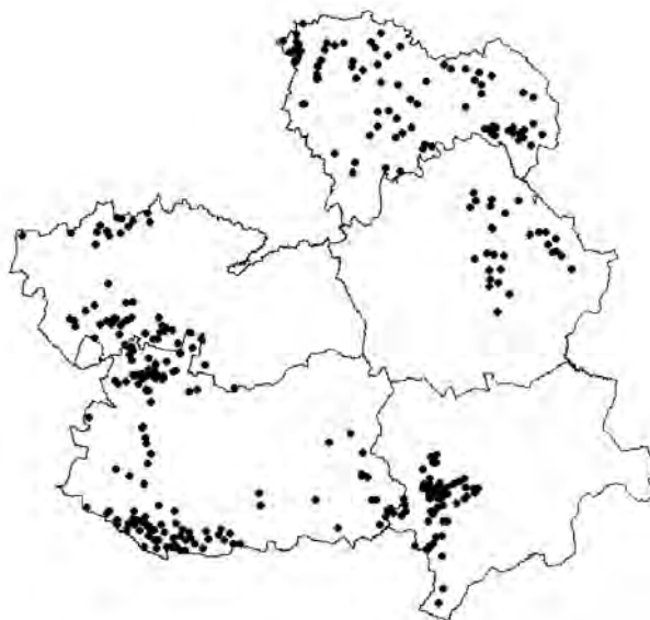
Figura 1 — Área de estudio con la localización de las 346 manchas de bosque estudiadas

aquellas que aparecieron en los 10 cm próximos al suelo, para evitar así contabilizar las especies terrícolas.