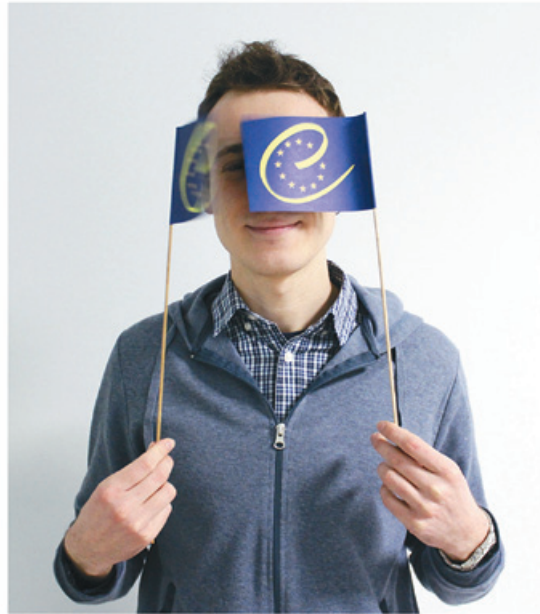
Open up to new horizons...

– Цягам конкурсу мы вельмі здзіўляліся нашай моладзі, што яе матывацыя імкнецца да нуля. А ў Еўропе такія конкурсы прыцягваюць вялікую грамадскую ўвагу. Мяркую, уся справа ў матэрыяльным заахвочванні – у адрозненне ад еўрапейскіх конкурсаў, дзе ўсё трымаецца на крэатыве, ахваце юнакоў данесці іншым свае ідэі, у нас вядзе рэй прагматычны разлік.