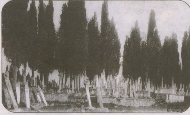
"Eski mezarlıklarda ölüm yaşayanları ürpertmez, yaşayan kenti güzelleştirirdi."

Bugün ancak şiir, resim, gravür, seyâhatnâme ve kartpostallarda kalmış olan eski İstanbul'un en güzel yerleri ise mezarlıklara ayrılmıştı. Çünkü