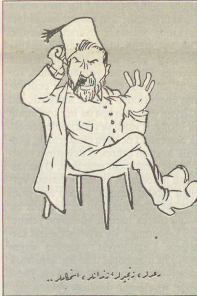
Sedat Nuri'nin çizgişiyle Abdullah Cevdet.

Avrupa dünyası daha ilk adımda, 20. yüzyılı bir teknolojik gelişme dönemi olarak planlamış ve gündelik hayatın kamusal ahlâkına, sanayi sektörünün çelik zırhını giydirmişti. Artık tekerlek