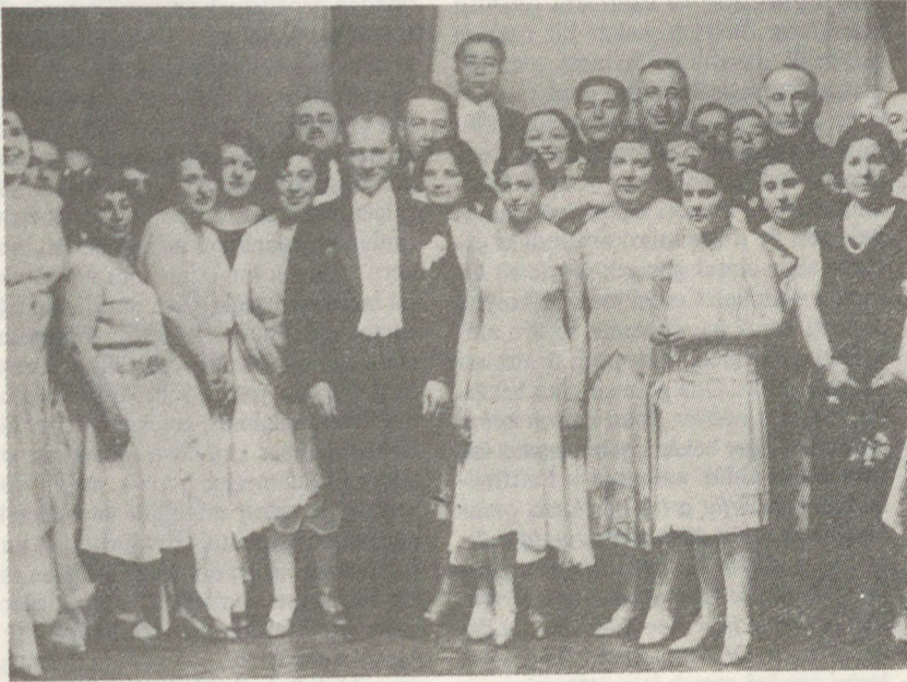
Cumhuriyet âdâb-ı muâşeretinin biçimlendiği ilk yıllarda Hariciye Köşkü'nde verilen bir baloda Mustafa Kemal.