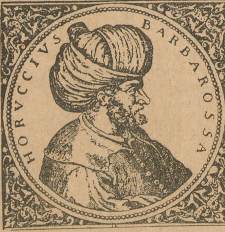
Barbaros, Cezayir Kralı Baba Oruç adını taşıdığı yıllarda. (Theodor Ebry'nin albümünden)

(Hatıraları tazelemek için tekrarlamak faydalıdır ki, «Capitulâtion» bir kale, bir şehir, bir memleket muharebe neticesinde düşmana teslim olunurken galip ile mağlûp arasında kararlaştırılan ve ekseriya galip taraftan zorla kabul ettirilen teslim olma şartları demektir. Devletin idaresinde, adliyesinde ve bilhassa iktisat ve maliyesinde dört asır mütamadı zararlar yapan ve mübalâğasız, imparatorluğun yıkılma sebeplerinden birini teşkil eden bu yer siz, hattâ haysiyet ve şerefe yukarı imtiyazları Osmanlılar, ikbal ve kudretlerinin en parlak, azamet ve gururlarının en yüksek devirlerinde, hakir ve fakir gördükleri frenklere lûtfen bağışlamışlardı. Hazine dolu idi. Frenklerin vergisine ihtiyaç yoktu. Ölülerine, dirilerine, evlenmelerine, ayırılmalarına neden karışıp da veba'e girmeli ve kirlenmeliydi. Kâfirler tıpkı «zimmi-ler ve raaya» gibi ne halleri varsa kendileri görsünlerdi.)