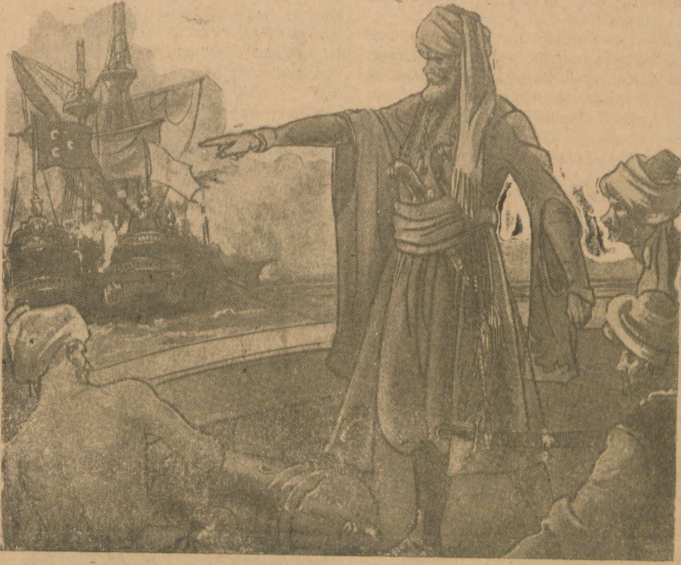
Kahraman Barbaros 1838 de Preveze zaferini kazanırken (Ressam Ercümen'din eski bir gravürü)

bin yediyüz defa muharebe ettikten sonra 6 ikincikânun 1492 de son payitahtları Grenadayı da kaybetmişlerdi. Şarlken büyük babası Fernan katoliğin kılıcından kurtulan Arapları kesti, kovdu ve Hris tıyanlaştırdı. İspanyanın kurtuluşu tam olabilmek için Afrikanın şimalinde, Araplar dan temizlemek lâzımdı. Mağriplilerle Ber