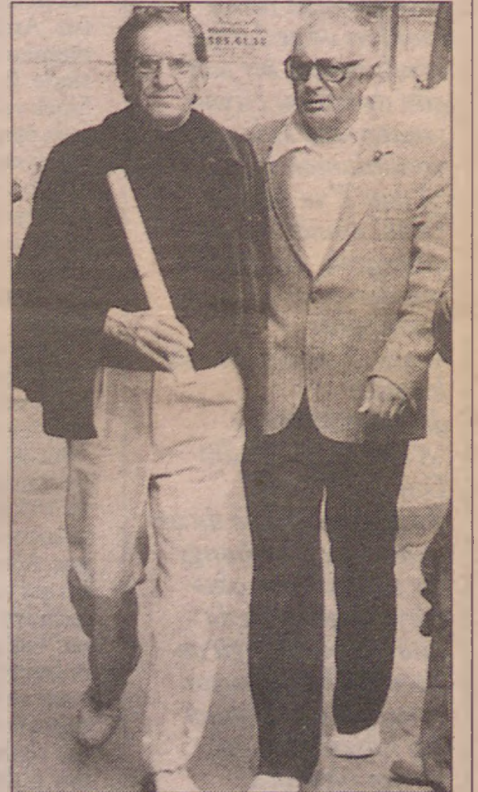
Abidin Dino ve Yaşar Kemal.

A'dan Z'ye Abidin Dino/ Derleme ve Metin: Zeynep Avcı/ Yapı Kredi Yayınları/ İstanbul 2000/ 291 s.