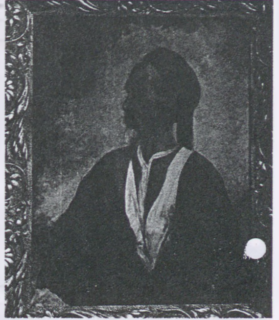
ayrıntıcı bir görüşle modelin psikolojisine kadar inen analizci" bir portre ressamıydı. Büyük tuval üze-