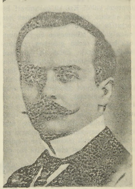
Hüseyin Cahit Yalçın

B ASIN tarihimizde önemli bir yer tutan Tanin gazetesinin ünlü başyazarı, hikâye ve roman yazarı Hüseyin Cahit Yalçın'ı (1874-1957) bütün edebiyat çevreleri ve okurlar tanır. Bu gazeteyi ilk defa birlikte çıkardıkları şair, öğretmen ve okul müdürü Tevfik Fikret'i (1876-1915)'de tanımayan, bilmeyen yoktur. Ancak bu iki değerli insan ve yakın arkadaşın aynı gazetede çalışırken birbirlerine düşman denecek derecede karşı olduklarını çok az kimse bilir. Tevfik Fikret, Hüseyin Cahit ve Hüseyin Kâzım (1908) İkinci Meşrutiyet yıllarında Tanin gazetesini birlikte çıkarırlarken aralarında beliren anlaşmazlık yüzünden Tevfik Fikret ayrılıp gitmişti. İş bu kadarla kalsa iyi. Fikret ile Cahit birbirlerine çok ağır dil kullanarak metup'lar göndermişlerdi?.. Bir zamanlar Tanin gazetesinde yazarlık etmiş ve sonra kendi çıkardığı Vakit gazetesinin başyazarı