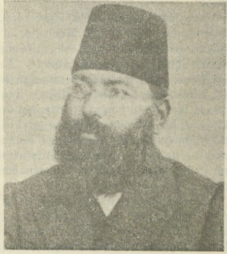
Devrin Maarif Nazırı Emrullah Efendi

Tevfik Fikret'in Hüseyin Cahit'e yazdığı ağır mektup ne idi. Bunu bilmiyorum. Fakat bu sırada ben, Tanin gazetesinde çalıştığım için, Cahit'in Fikret'e karşılık olarak yazdığı mektubun bir gazete kenarına yazılmış müsveddesi elime geçmişti. Bu müsveddeden mektubun bir suretini almıştım. Hâlâ yanımda mahfuz olan müsveddeyi tarihi bir vesika olarak buraya koyuyorum.