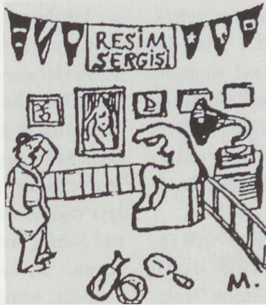
Sergide yer alan nüler tatsız bir olayın yaşanmasına neden oluyor.

bir farkı yok. Tabii şekil itibariyle. Oysa içeriği çok çok farklı. Gazete bu girişimini şöyle duyuruyor: "Bu günden itibaren takdim edeceğimiz kuponla sergiye gidecek olan okuyucularımız bu kuponu göstererek yüzde elli tenzilatla yani on kuruşla girebilecekler ve içerideki beğendikleri bir tabloyu parasız almak ihtimalini de kazanmış olacaklardır. Bu da şu suretle olacaktır: Kupon sahibi, esasen hepsinin üzerinde numara olan tablolardan en beğendiğini numarasını kuponu, adresile