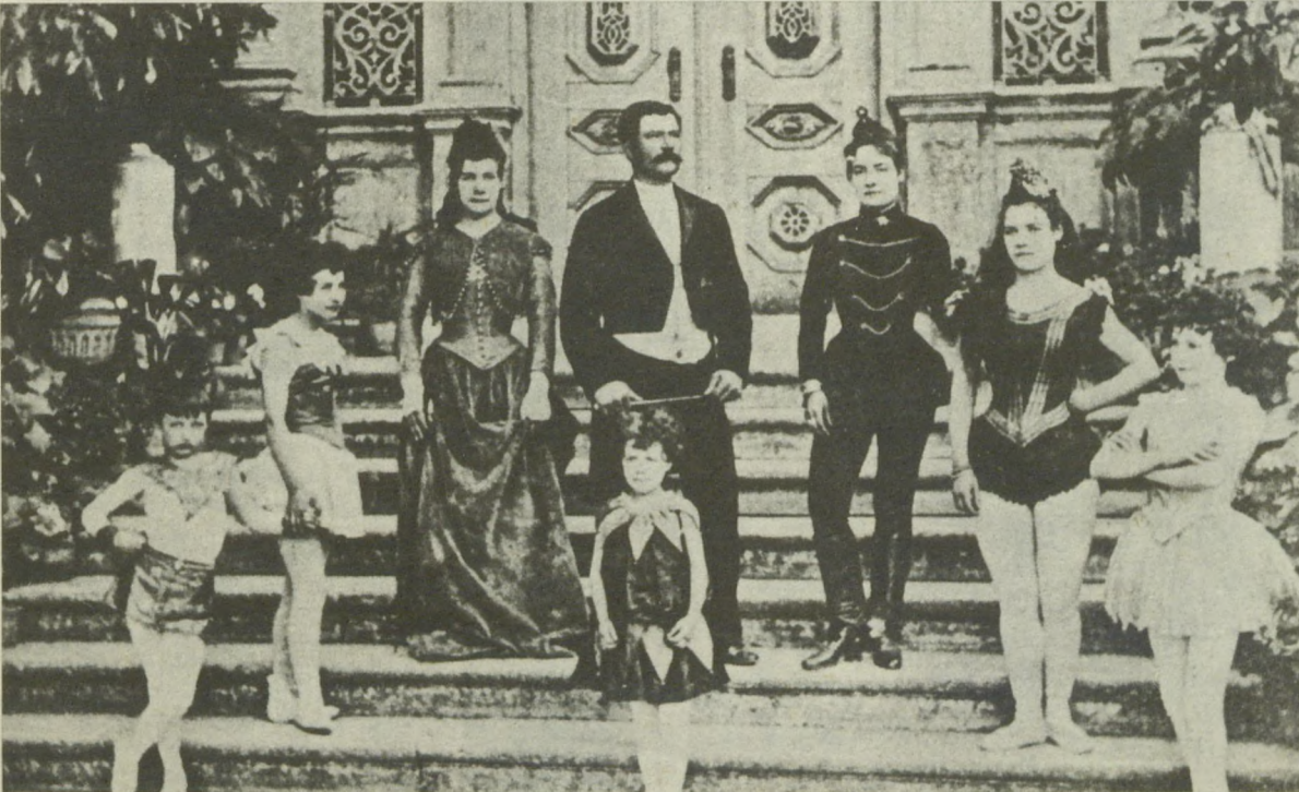
BİR YABANCI TRUP — 1800'lerin İstanbul'una temsiller vermek üzere gelen bir İtalyan trupunun sanatçıları toplu halde...