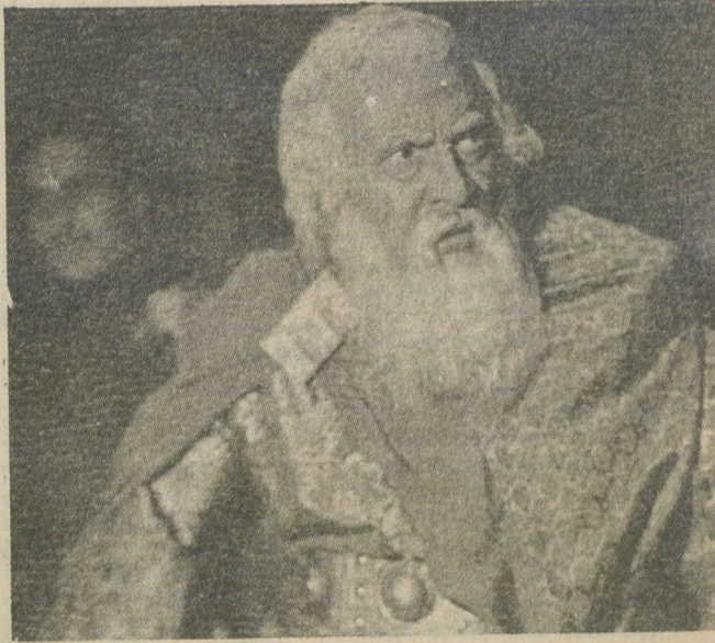
Shakespeare'in "Kral Lear"inde (1944)