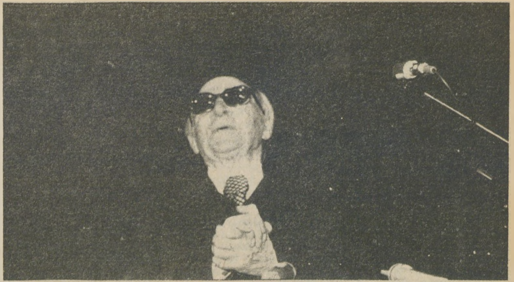
Ege Üniversitesi'ndeki törende konuşmasını yaparken