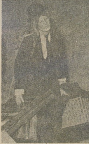
"Godot'yu Beklerken" (1955)

Geleceğin seyircisini yetiştirmek amacıyla kuracağı çocuk tiyatrosu için incelemelerde bulunmak üzere Moskova'ya gitti. Natalia Satz'la görüşmeler yaptı. Anton Çehov'un karısı Olga Knipper ile tanıştı. Bu gezisi sırasında Stanislavski'yi, Ankara'da kurulacak Devlet Konservatuvarı'nın yönetimi için Türkiye'ye davet etti. Bu davet kabul edilirse de, sonradan çeşitli nedenlerle gerçekleşemedi (Eylül 1934).