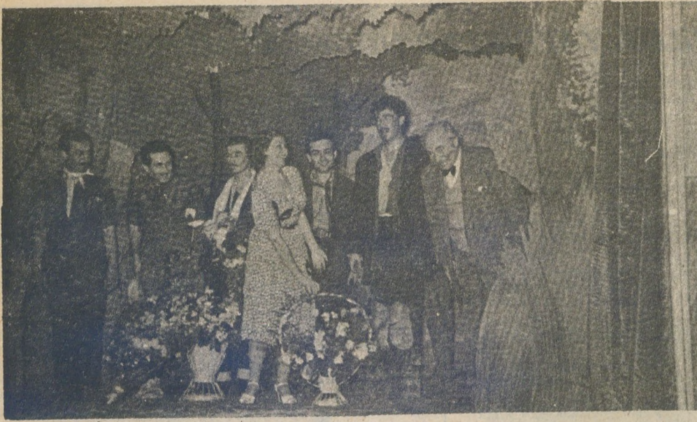
Küçük Sahne'nin açılış gecesi "Fareler ve İnsanlar"dan sonra