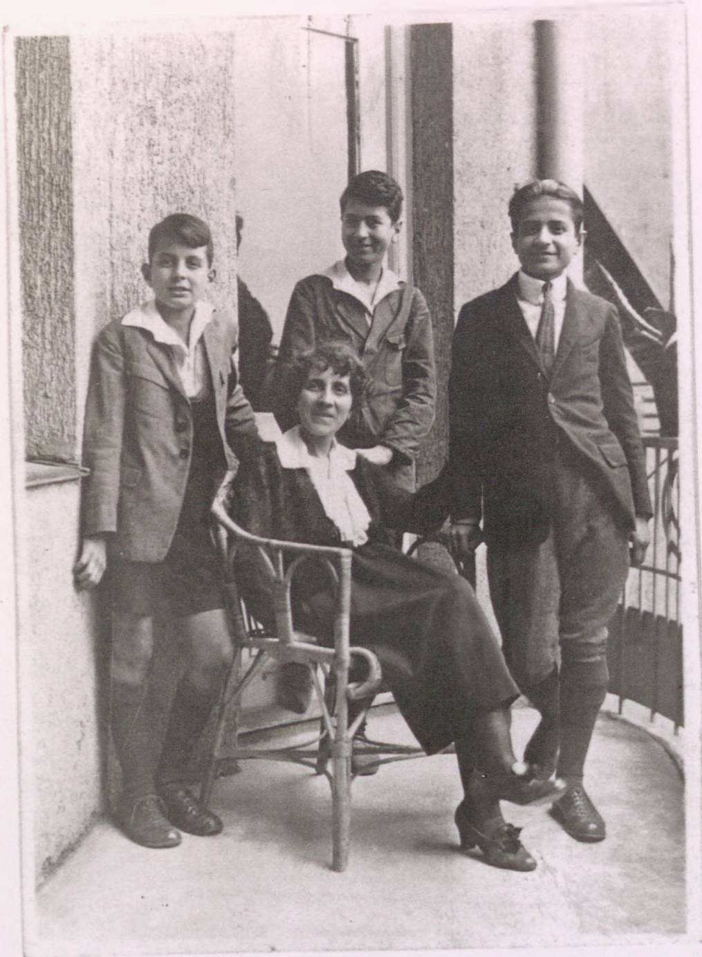
واد - سداد - سعدي (أولهم) قرينه آنة لری ایله