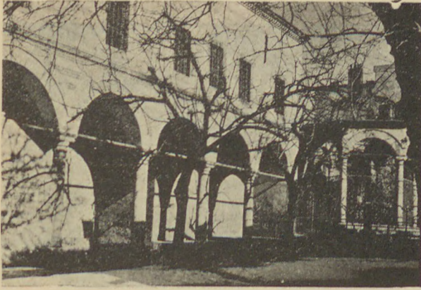
Ragıp Paşa Kütüphanesinin meşruası Dépendance de la Bibliothèque de Ragıp Pacha.