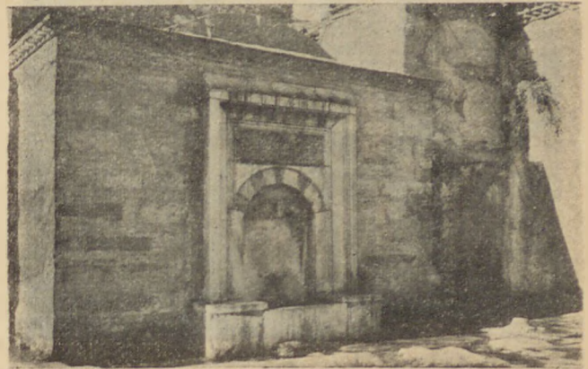
Ragıp Paşa Kütüphanesinin Çeşmesi Fontaine de la Bibliothèque de Ragib Pacha.