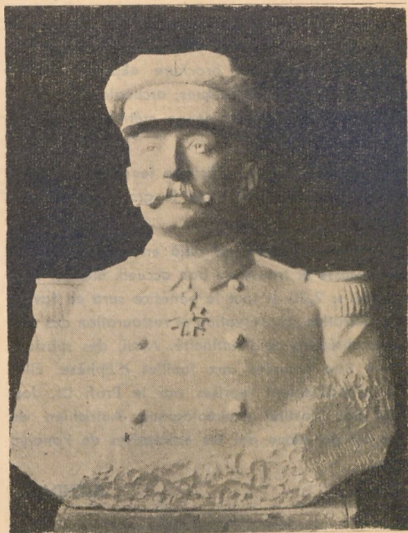
Pierre Loti'nin büstü Monument de Pierre Loti à St. Pierre d'Oléron