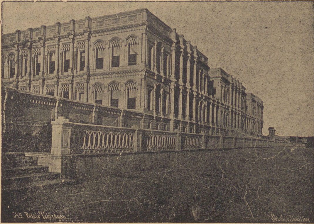
Istanbul — Çırağan Sarayı Le Salon du Sultan au Palais de Çırağan (avant l'incendie de 1910)

Çırağan sarayının turistik otel haline getirilmesi yeniden günün meselesi halini aldı. Amerika'da büyük oteller işleten bir grupun bu işle meşgul olduğu bildiriliyor. Yapılan tetkikler iyi netice verirse Emekli Sandığı ile müştereken saray tâmir edilecek ve bir otel haline getirilecektir.