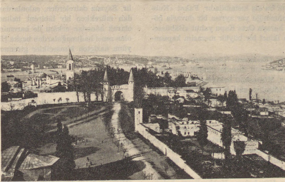
Istanbul — Topkapı Sarayı Istanbul — Vue d'ensemble des Palais de Topkapou.

Topkapı Sarayı, İstanbul şehrinin en mu- tenâ yerinde, liman ağzında, Karadeniz Boğazı- nın karşısında kurulmuştur. Yarımadanın bu köşesi, Osmanlı Pâdişahlarının beşyüz senelik tarihî ikametgâhına nisbetle Sarayburnu adını taşır. Nâzımı meçhul mısralarda bile haşmetin ifadesi altın pırıltıları vardır: