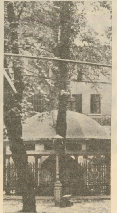
İstanbul'daki Arap Camiinin şadırvanı...

Ve sevimli Evliya Çelebi'miz bu rüyâdan sonra hakikaten dünyayı dolaşır. Dolaştığı yerlerde gördüklerini işittiklerini birbir yazarak meşhur «Seyyahatnâme»sini meydana getirir.