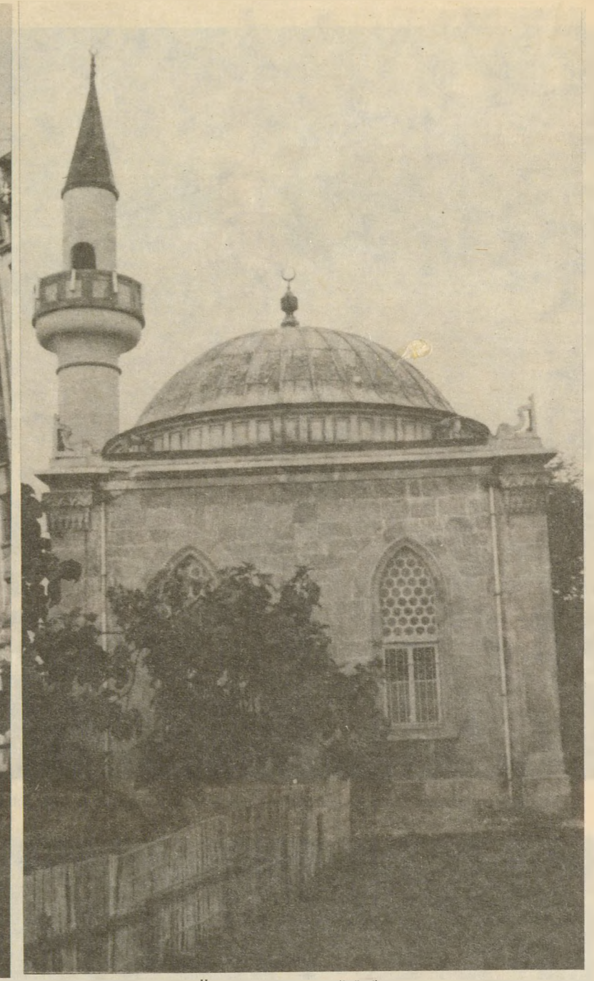
Kadıköy ACIBADEM CAMİİ'nden bir başka görünüm...

Ahî Çelebi Camii'ndeki sabah namazı sırasında yanında namaz kılan ak sakallı ve nur yüzü zâtın Saad bin Ebû Vakkas olduğunu anlayan Evliya Çelebi'ye «cümle ervah-ı evliyâ ve asfiyâ»yı onun tanıttığını; en