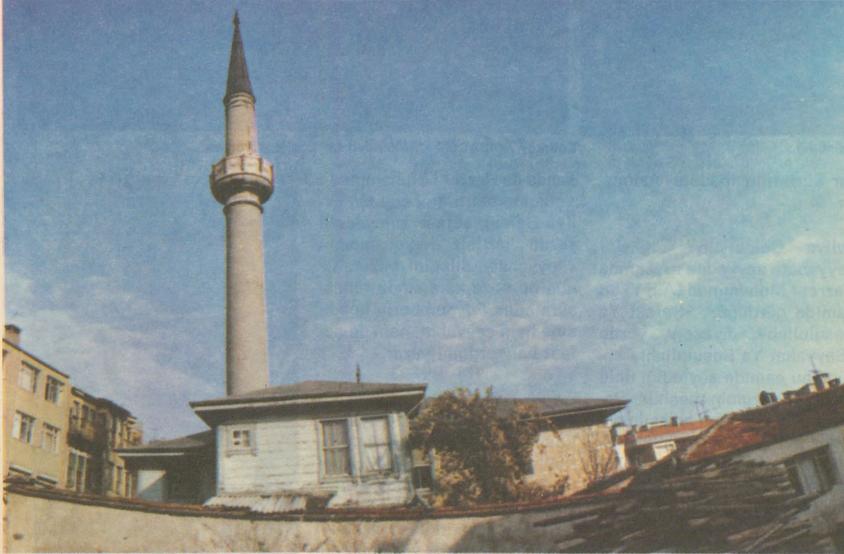
Beşiktaş'taki ABBAS AĞA CAMİİ çok sade ve kesme taş işçiliği ile bina olunmuştur.

olunduğu bilinir. Mimar Sinan'ın eseri olan binadan, altındaki medresenin tonoz duvarlarından başka birşey kalmamıştır. Önce dört filpâye üzerine oturtulmuş olan kubbe de yıkıldığından yerine kiremitle