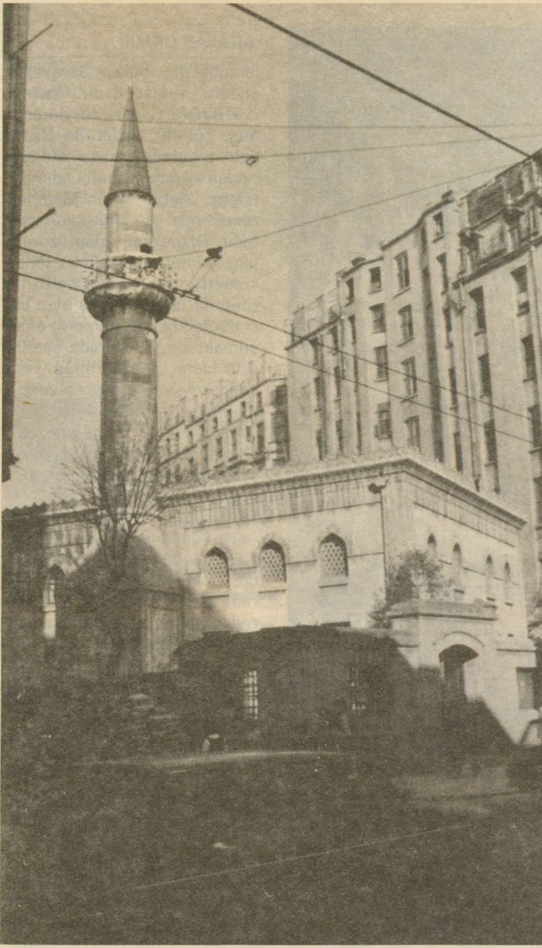
Beyoğlu'ndaki AĞA CAMİİN bir diğer görünümü...

varlara oturduğu halde yanlarda ikişer kalın kemerle kalın ayaklar üzerine oturtulmuştur.