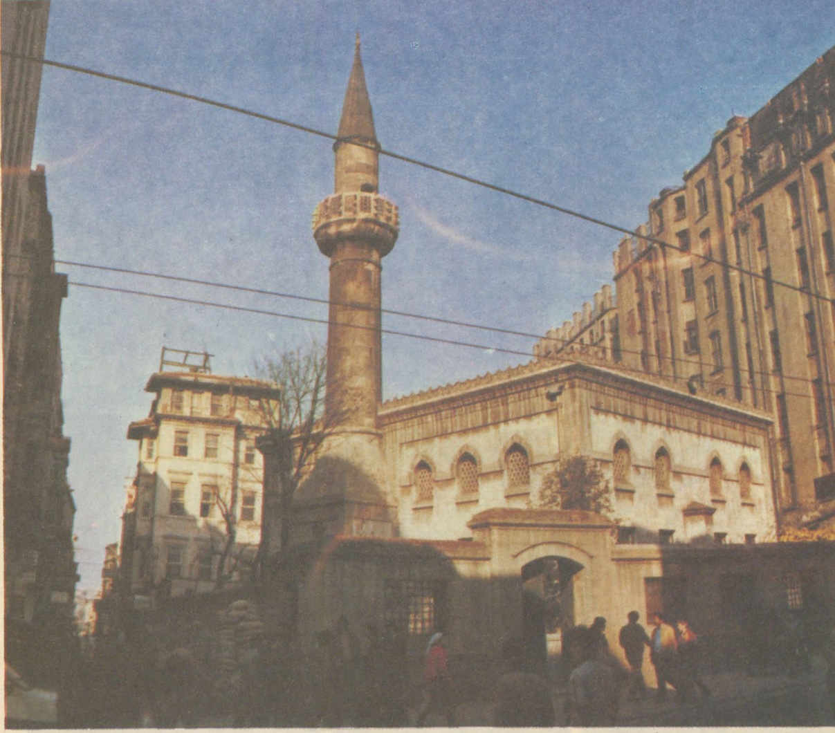
İstanbul'un Beyoğlu semtinde İstiklâl Caddesi üzerinde bulunan ve 1597 yılında inşa olunan AĞA CAMİİ...