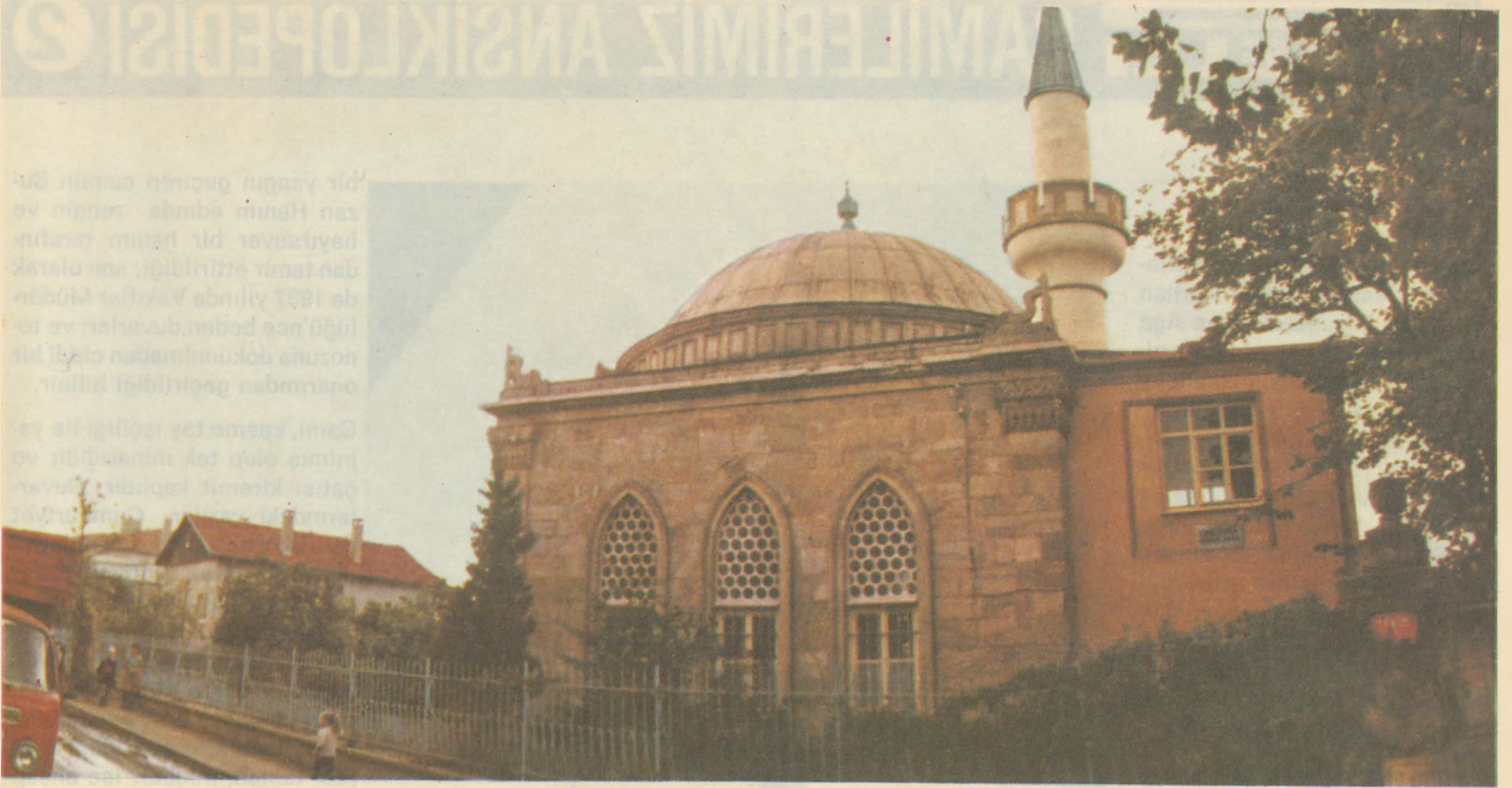
19. Yüzyıl Osmanlı mimari eserlerinden olup, kare plan üzerine taş duvarlı olarak inşa edilmiş bulunan Kadıköy ACIBADEM CAMİİ...