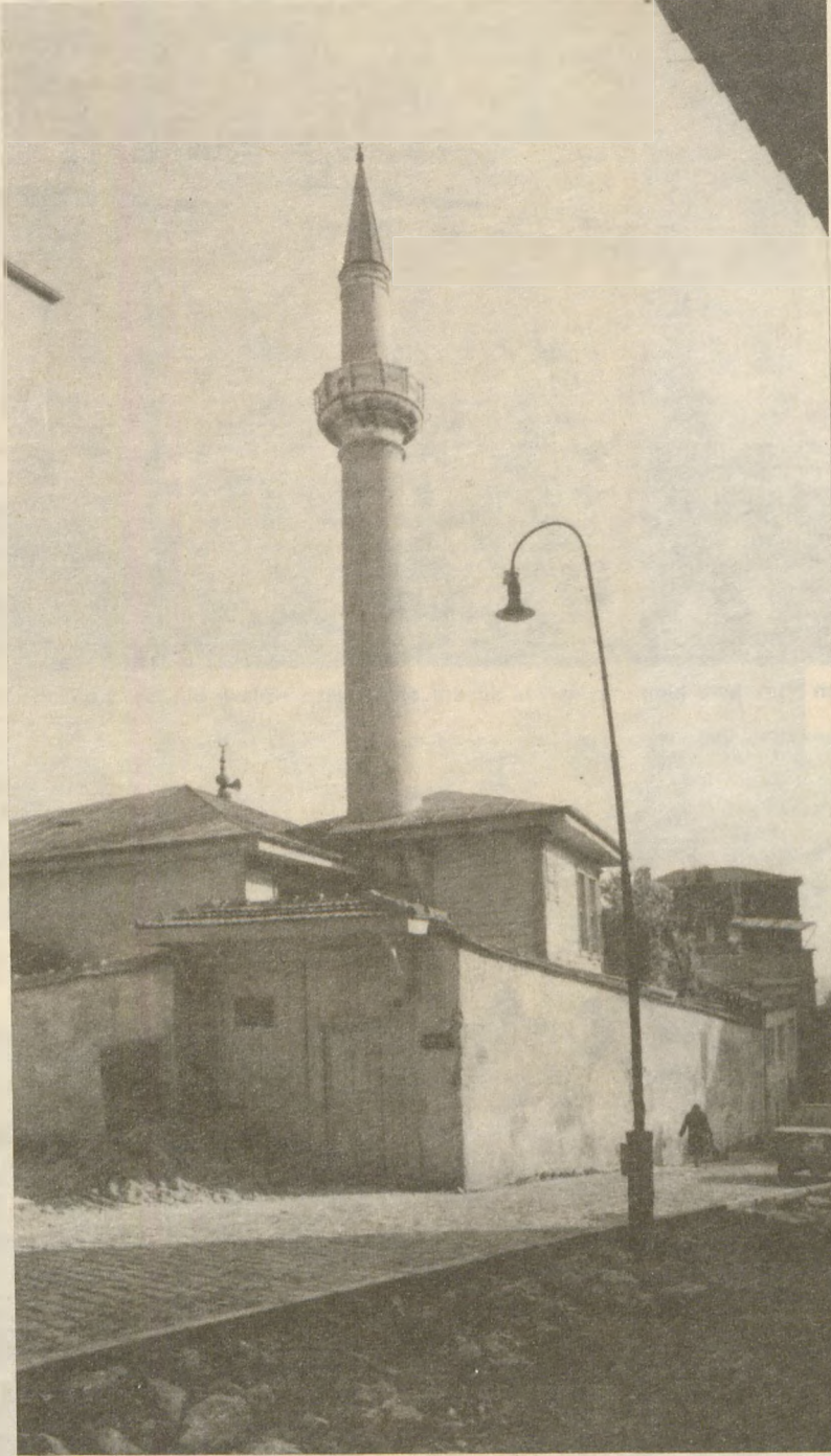
1666 yılında Hatice Turhan Sultan'ın Başağası Abbas Ağa tarafından Beşiktaş'ta yaptırılan ABBAS AĞA CAMİİ...

Çok sade bir mimarisi olmasına rağmen şirin bir görünüş arzeder. Son cemaat yerinin 1857