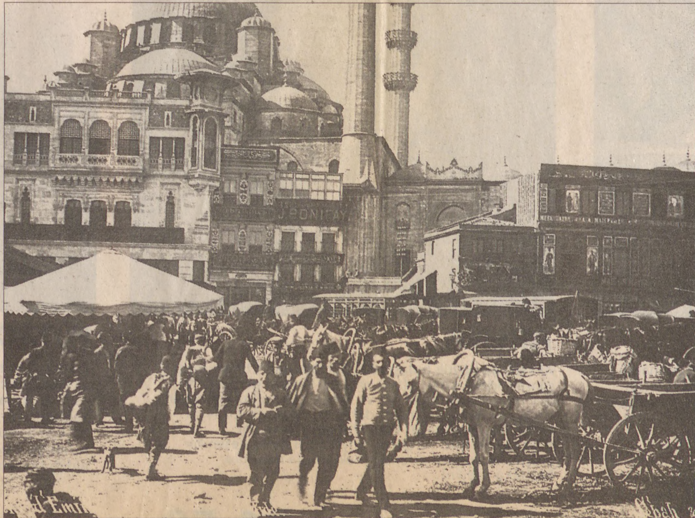
1890’lı yıllara ait bir başka fotoğrafta, birinci tepesyle ikinci tepesi ayıran Eminönü’ndeki Yeni Camii ve civarı görülüyor.