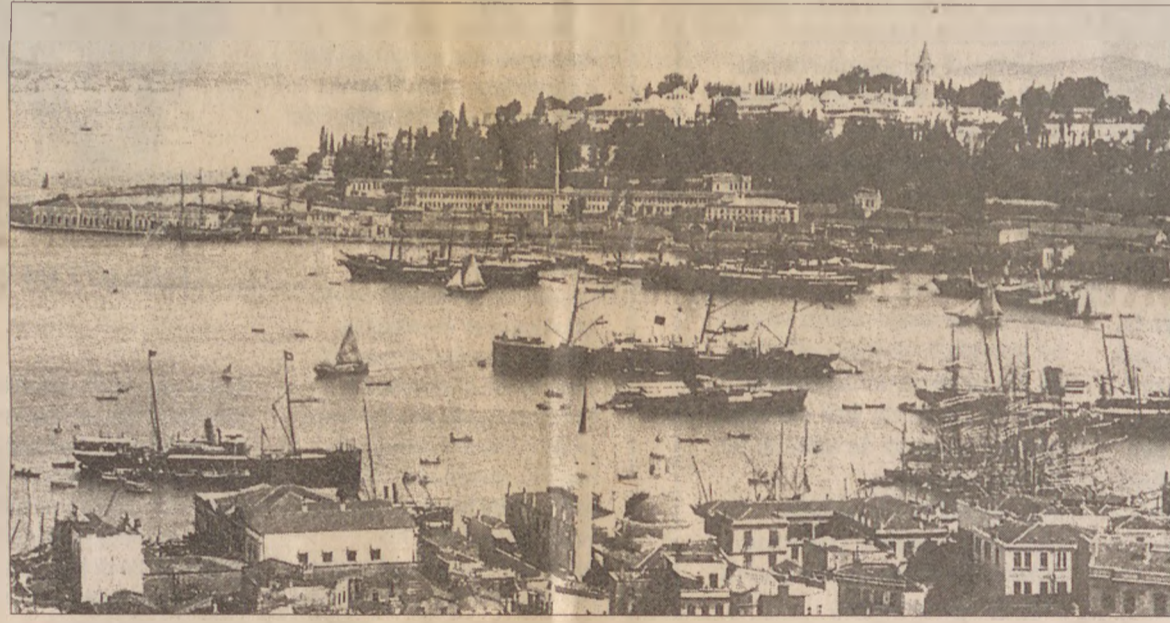
Üzerinde Ayasofya ve Sultan Ahmet camilerinin de yer aldığı Sarayburnu birinci tepe.

Dördüncü tepe, üstünde Fatih Külliyesi bulunan güneyde Lykos deresi vadisine