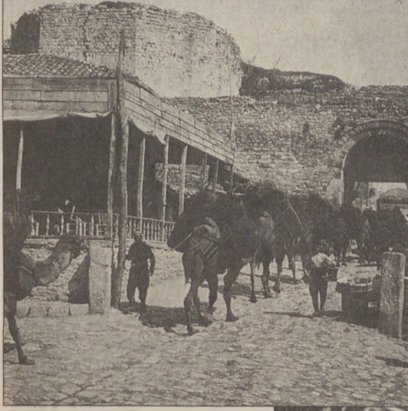
Kariye Camii'nin yer aldığı Edirnekapı altıncı tepe.

İstanbul deyince ilk akla gelenlerden biri de yedi tepeli kent oluşudur. Yedi tepesi şarkılara, şiirlere konu olmuştur. Yerli yabancı, şehir üzerine düşünen herkes bu yedi tepeye sarılmış, ondan ilham almıştır. İyi de bugün ucu bucağı belirsiz bu şehirde yaşayanlar, bu yedi tepenin nerelerde olduğunu, bu tepelerde hangi yapıların yükseldiğini biliyorlar mı? Çoğunluk için bu soruya olumlu bir yanıt vermek çok zor.