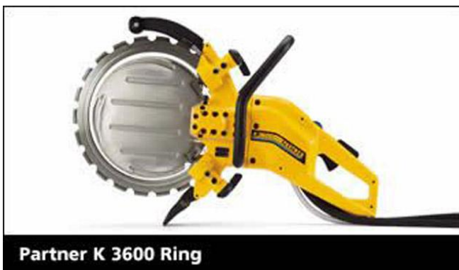
KUVA 3. Rengasterässäsa

Käsisahausta käytetään yleensä seinän ja holvin aukkojen käsivaraiseen sahaukseen. Pilareiden, palkkien ja betonipaalujen katkaisussa käsisahaus on yleinen menetelmä. Käsisahoja on ketjullisia, laikallisia ja rengastyypisiä sahoja. Ketjulliset käsisahat ovat yleensä polttomoottorikäyttöisiä. Ketjusaha muistuttaa paljolti moottorisahaa. Laikkasaha on hieman suurta kulmahiomakonetta muistuttava polttomoottorikäyttöinen saha, jossa laikka on kiinnitetty sahaan laipan keskeltä, eli koko laikka pyörii leikatessa. Laikan maksimikoko on 400 mm, josta maksimisyvyys on noin 40 prosenttia. (Kuvat 3 ja 4.)