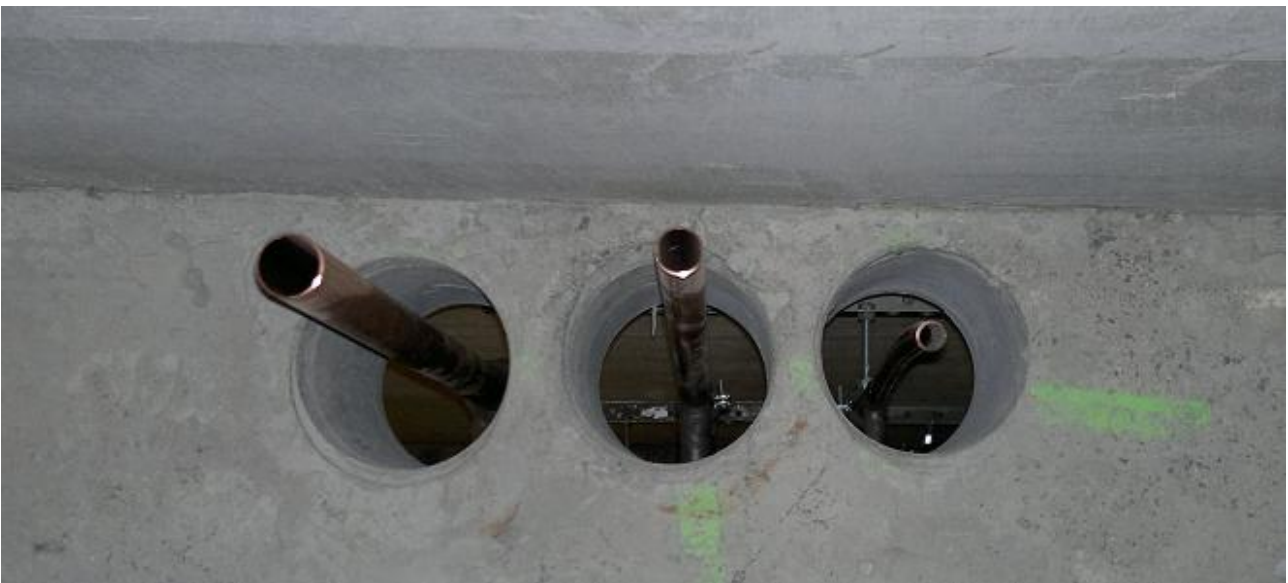
Kuva 11. Vesiputkien liian suuret läpiviennit

Hankinnalliset ongelmat olivat työmaan suurin riesa. Ongelma oli pahimmillaan työmaan alkuvaiheilla, mutta parani aina loppua kohden. Töiden loppuvaiheilla työ sujui jo kiitettävällä tasolla. Tämä ongelma johtui täysin timanttitoistä vastaavasta yrityksestä ja siitä, ettei se ollut varautunut työhön sen vaatimilla resursseilla. Porausurakoitsijalla oli suuria ongelmia saada työmaalle riittävästi työntekijöitä ja lisäksi saada työntekijät