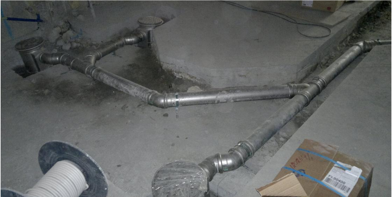
Kuva 7. Keittiön viemäröinnin roilotus