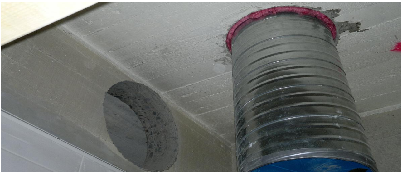
Kuva 6. Läpivienti ilmastointiputkelle

Työn kohteena oli Kaukovainion monitoimitalo, jonka saneerauksessa pääurakoitsijana toimi Oululainen saneeraukseen erikoistunut rakennusliike. Aliurakoitsijana oli erillinen purkutöihin erikoistunut yritys joka hoiti kaikki betonipurkutyöt sekä vastasi asbestitöistä. Työn tavoitteena oli saada uudet läpiviennit uusille LVIS-asennuksille kohteessa sekä uusien ovi-aukkojen teko. Kohteessa oli porattavana ja sahattavana uusia läpivientejä sekä oviaukkoja kolmessa kerroksessa ja noin 6000 brm 2 alueella yhteensä noin 1600 reikää ja 70 oviaukkoa. Kohteessa oli myös paljon lattiaroilotusta uusille viemäröinnille sekä muille lattiaan tuleville vedoille. Läpivientien koot vaihtelivat 50 mm:stä aina 600 mm:iin. Poraus- sekä sahausyössä työnjohto tuli pääurakoitsijan puolelta ja työvoima sekä työvälineistö aliurakoitsijalta. Työryhmänä kohteessa toimi suunnitelmien mukaan 2 poraajaa ja 1 sahaaja. Työryhmän koko vaihteli tilanteiden ja tarpeiden mukaan (tästä eteenpäin poraajia tai sahaajia kutsutaan yleisesti timanttityöntekijöiksi koko loppuraportin ajan). Timanttityöntekijät huolehtivat aukkojen sekä läpivientien teosta. Yksi työnjohtaja, joka huolehti aukkojen sekä läpivientien merkkauksesta, aikataulutuksesta sekä paikalleen mittauksesta, osoitettiin pääurakoitsijan puolelta. Esimerkkinä kuva ilmastointiputkelle poratusta läpiviennistä (kuva 6 ) sekä kuva keittiön viemäröinnille tehdystä roilotuksesta (kuva 7).