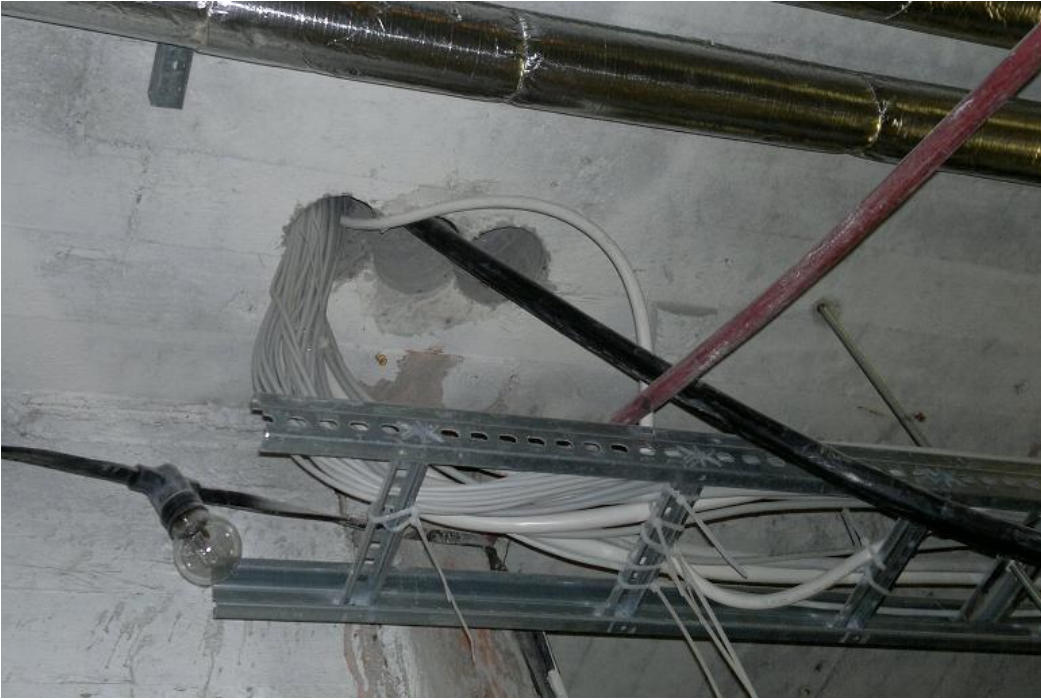
Kuva 10. Sähköpuolen liian suuret läpiviennit