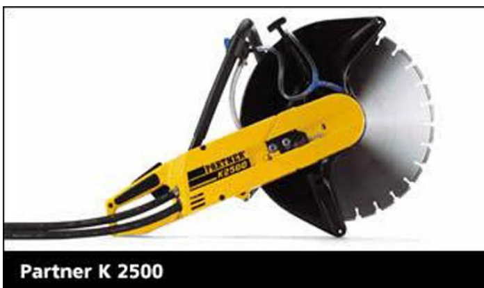
KUVA 4. Käsisaha