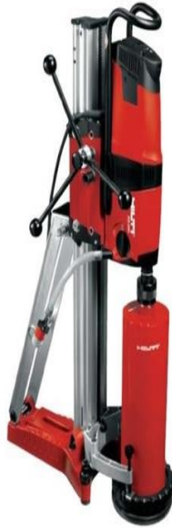
KUVA 5. Timanttipora

matalammat reiät. Jalustallisella tehdään suuremmat ja syvemmät reiät. Jalustallisella, ankkuroitavalla mallilla pystytään myös suorittamaan vinoporauksia. Jalustassa on portaaton kulman säätö, mikä mahdollistaa vinoporauksen. Timanttiporan maksimiteräkkö on 1200 mm. Timanttiporat ovat vesijäähdytteisiä. (Kuva 5.)