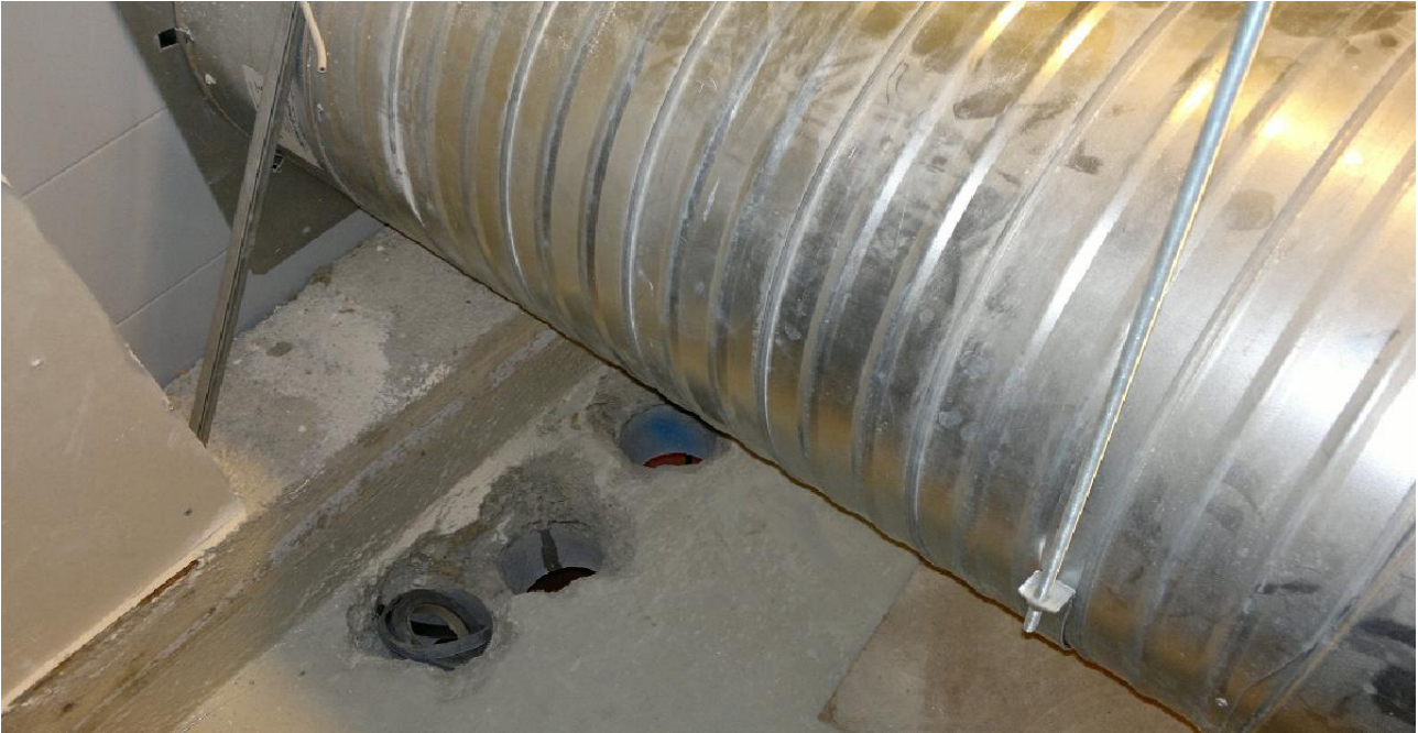
Kuva 9. Ristiriitaiset läpiviennit ilmastoinnille sekä vesiputkille

Suurin tekninen ongelma oli veden saanti. Porauksessa ja sahauksessa jäähdytyksessä käytettävä veden saanti tuotti työmaan alussa ongelmia. Syynä veden saannin vaikeuteen oli, että putki-asentajat eivät saaneet asennettua kunnollista liittymää vesirunkolinjaan. Näin ollen kaikki timanttitoissa käytettävä vesi oli aluksi lastattava säiliöihin ja sen jälkeen vesikanistereiden avulla kannettava porauskohteeseen, mikä merkittävästi hidasti poraustöitä. Ongelma ratkesi, kun työmaalle saatiin oikeanlainen liitännä vesirunkolinjaan. Tässä tilanteessa tavallaan hidastuneet poraustyöt hidastivat putkitöitä, jotka taas puolestaan hidastivat poraustöitä.