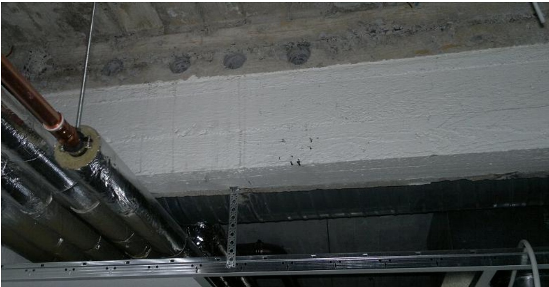
Kuva 8. Reiät kantavassa palkissa

Rakennesuunnittelija oli varmistanut ja hyväksynyt etukäteen kaikki reikäkuviissa esiintyneet reiät, jotka olivat kantavissa rakenteissa. Esimerkkinä kuva 8 kantavaan palkkiin tehdyistä rei'istä, jotka rakennesuunnittelija oli hyväksynyt.