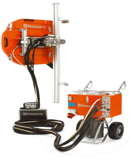
KUVA 2. Seinäsaha

Seinäsaaha käytetään yleensä seinä- ja ikkuna-aukkojen tekemiseen tai suurentamiseen. Seinäsaha on kiskoilla liukuva suuri timanttisaha, jolla päästään jopa 900 mm sahaussyvyyteen. Seinäsahan kiskot kiinnitetään ankkuroimalla kohteeseen. Seinäsahat ovat voimavirtakäyttöisiä. (Kuva 2.)