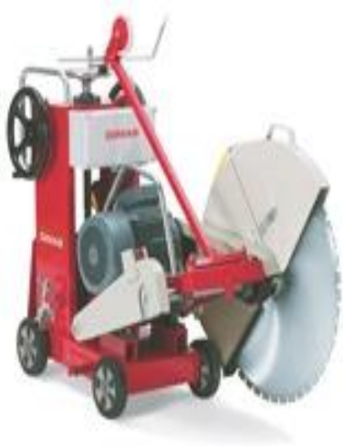
KUVA 1. Holvisaha