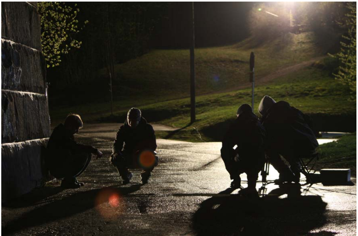
Kuva 2. Lyhytelokuvan Veri 9. kuvauspäivä. Joskus on aika hengähtää.