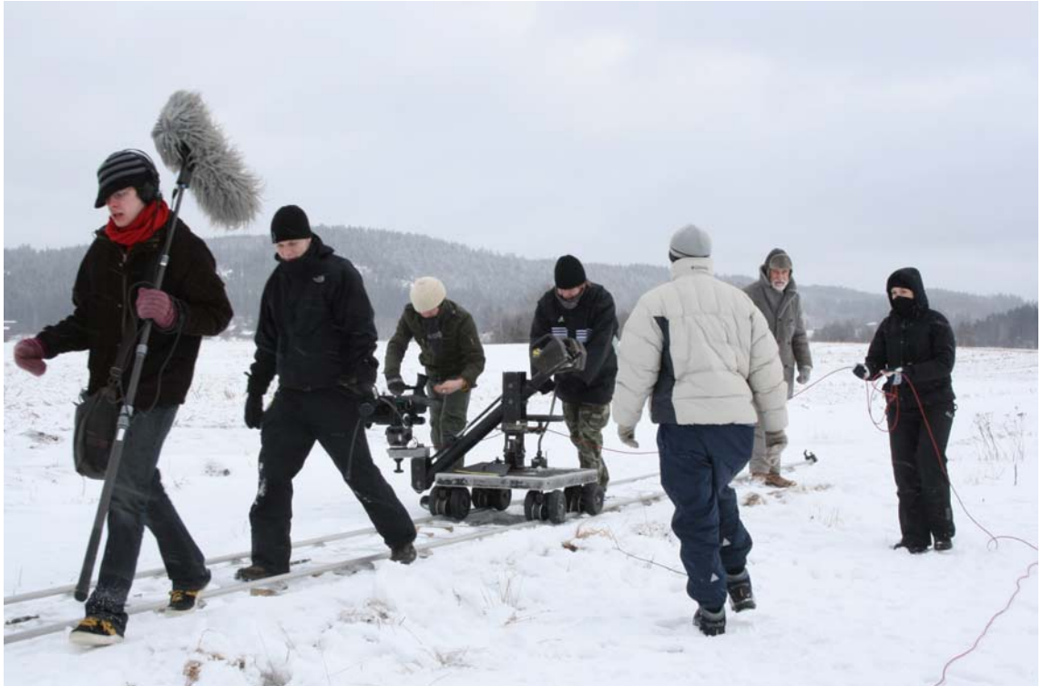
Kuva 3. Lyhytelokuvan Morocco 1. kuvauspäivä. Pienellä ryhmällä pärjätään äärimmäisissäkin olosuhteissa.

Opettavaisinta taas oli joutua pohtimaan ja ratkomaan käytännössä apulaisohjaajan roolin kaksinaisuutta ja vaikeutta olla yhtä aikaa johtaja ja kaveri. Tämnäkaltaisilta kamppailuilta ei varmasti välttyä missään ystävien kesken toteutettavissa projekteissa, mutta kokemus on kultaakin kalliimpaa. Ehkä seuraavissa kuvauksissa löydän paikkani kivuttomammin.