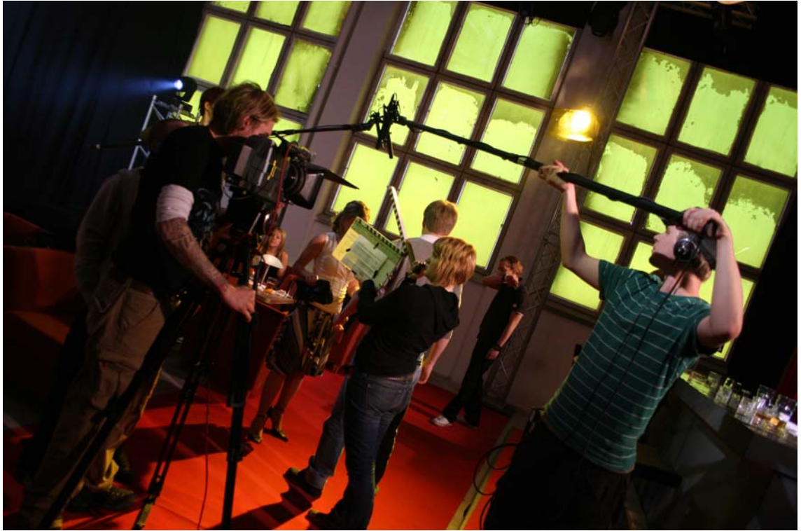
Kuva 1. Lyhytelokuvan Veri 5. kuvauspäivä. Isossa ryhmässä kaikki tietävät mitä tehdä.