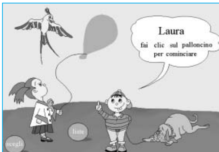
Figura 1 Videata iniziale del programma Tachiscopio .

a cura di Michela Ott ITD-CNR, Genova ott@itd.ge.cnr.it