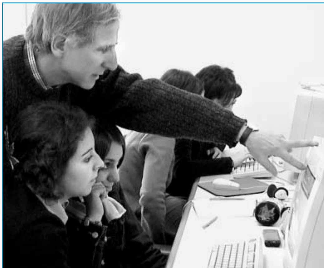
Figura 1 I ragazzi incontrano gli esperti.

La strategia di lavoro privilegiata in questa fase è stata quella del “lavoro cooperativo”, strategia che risulta particolarmente motivante per docenti e studenti e che