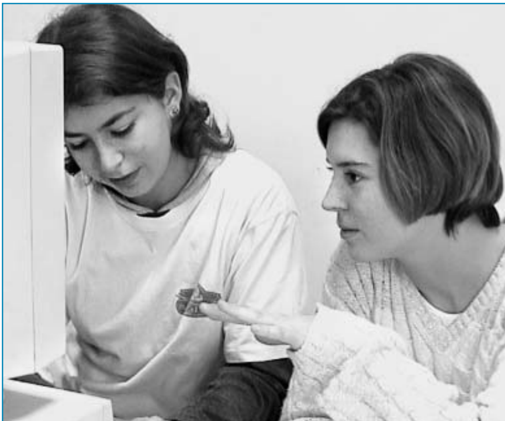
Figura 2 I ragazzi cercano insieme informazioni sulla rete.

Dagli incontri è emerso che la competenza dei ragazzi sull’uso del computer e di Internet è diversificata, ma sorprendentemente alta. Anche i meno esperti, lavorando insieme ai compagni, hanno facilità a familiarizzare con lo strumento, poiché agiscono in una situazione di la-