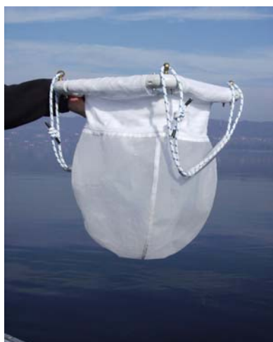
Fig. 5 - Retino utilizzato per sciacquare i campioni