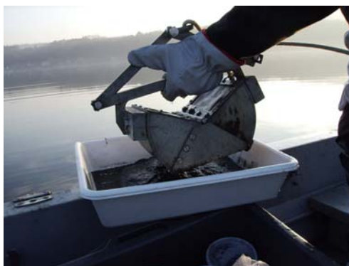
Fig. 4 - draga Ponar

Questi strumenti sono in grado di fornire misure quantitative (individui*m -2 ).