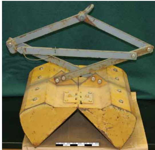
Fig 3 - draga di Petersen

La draga di Petersen (Figura 3) ha una superficie di cattura di 400-574 cm 2 ed è stata in passato una delle più usate. E' più pesante ed è suggerita in substrati sabbiosi.