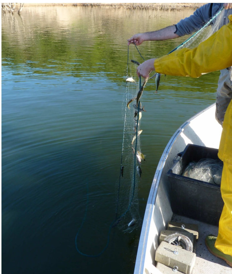
Foto 2 Particolare di una rete multimaglia e del suo catturato.

Il metodo proposto si basa su un campionamento stratificato della colonna d'acqua e sulla definizione casuale delle stazioni di campionamento. Il numero di strati, di stazioni di campionamento, nonché il numero di reti da utilizzare per ciascuno strato, sono determinati in base alla superficie e alla profondità massima del lago.