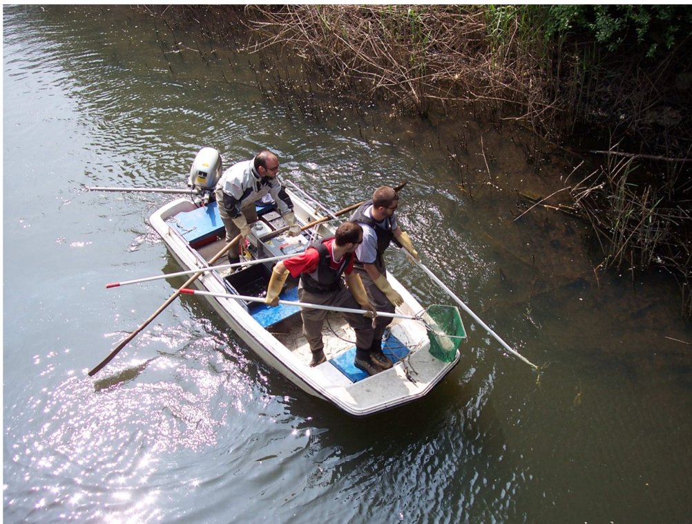
Foto 1 Operazioni di elettropesca con imbarcazione.

Il campionamento con EP deve essere fatto per punti ( Point Abundance Sampling Electrofishing-PASE ) utilizzando il generatore nella modalità "corrente continua".