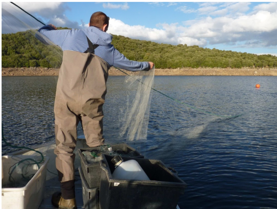
Foto 3 Posa di reti mesopelagiche.

Le RMP devono essere posizionate - se possibile - in corrispondenza della zona lacustre che presenta la massima profondità.