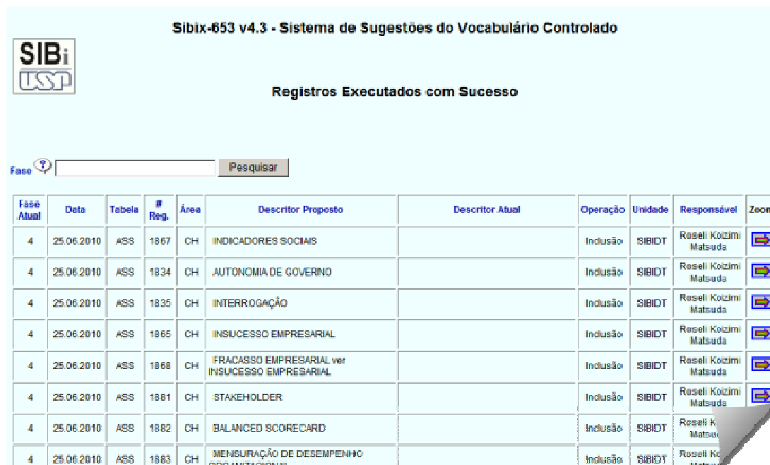
Figura 3: Relatório de Registros Executados da Base de Sugestões

O histórico de sugestões pode ser acompanhado pelo solicitante através dos relatórios disponibilizados pelo sistema de sugestões com indicação da fase em andamento, o que permite a elaboração das estatísticas da gestão do Vocabulário (Figura 3).