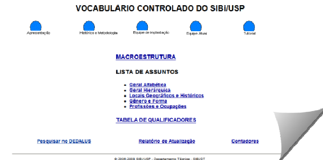
Figura 1: Vocabulário Controlado do SIBi/USP

O projeto contou com o suporte de informática do Departamento Técnico do SIBi/USP (DT/SIBi) para a primeira versão da base de dados em CD-ROM, na implementação do uso do Vocabulário em 2001 pelo Banco de Dados Bibliográficos da USP (DEDALUS), catálogo on-line das bibliotecas do SIBi/USP e na disponibilização para acesso on-line do Vocabulário ao público pela WEB, apresentado a seguir na Figura 1.