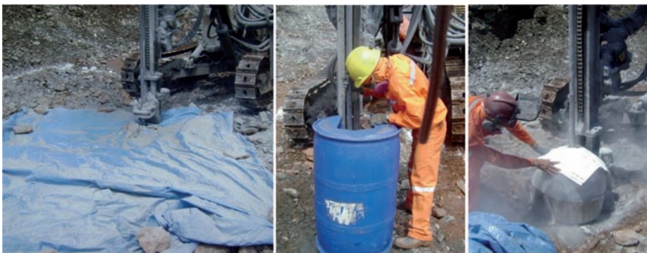
Figura 3 Diferentes procedimentos de amostragem: lona, tambor e amostrador setorial.

de furos de desmonte, quando realizada adequadamente, reduz a produtividade da perfuração. Esse cenário pode ser melhorado se levarmos em consideração os erros de delimitação, extração e ponderação do incremento (IDE, IEE e IWE), bem como o fenômeno da segregação, e