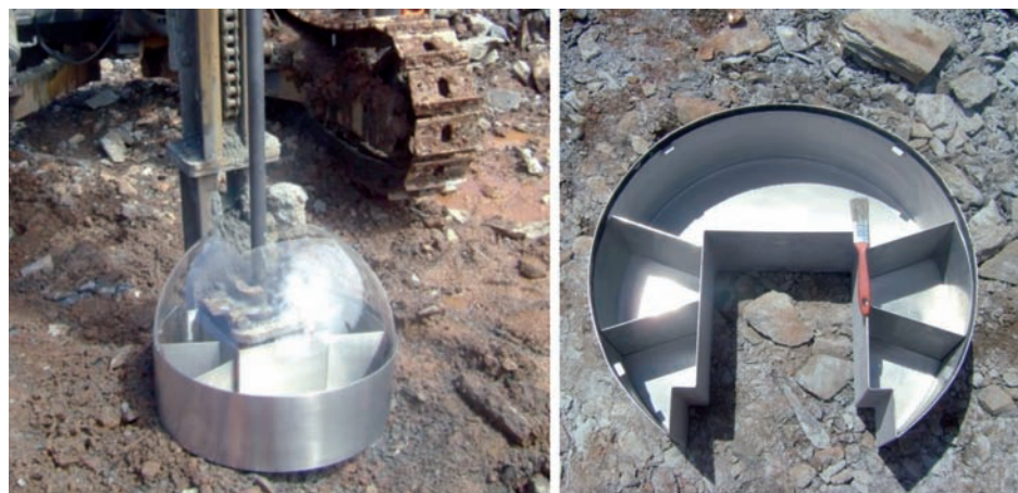
Figura 2 Amostrador setorial acoplado à perfuratriz e detalhe dos recipientes e da armação.

ros, entre 1 m e 3,5 m de profundidade, foram amostrados com o novo equipamento, usando-se uma perfuratriz Pró-Eletro, modelo PWH-5000, com broca de 3" (76,2 mm) de diâmetro e uma única descarga de material em sua parte frontal. Nesse estudo, cada recipiente gerou uma amostra. As amostras então geradas foram denominadas de Amostra A e Amostra B e foram analisadas separadamente.