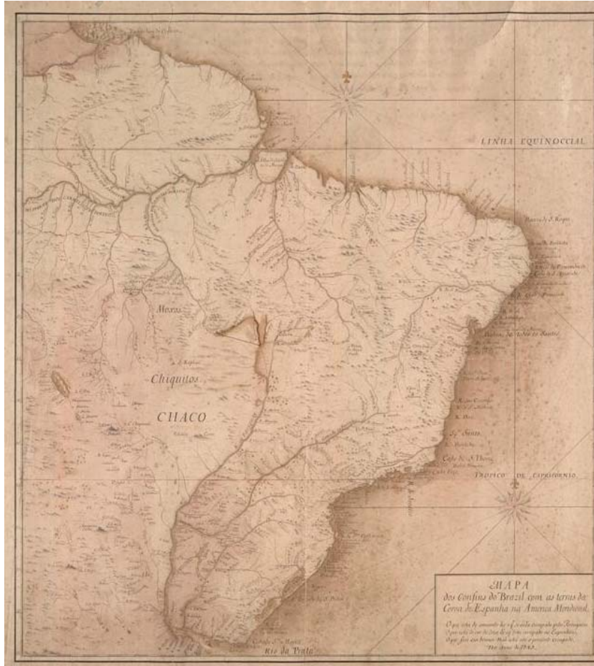
Figura 3 – Mapa das Cortes ou Mapa dos confins do Brasil com as terras da coroa de Espanha na América Meridional, 1749 .

graus, alternando trechos escuros e claros. A linha do trópico desenhada em tom avermelhado não possui graduação. O interior dos rios de margem dupla, de lagos e de pântanos possui uma cor sépia mais intensa, como ocorre também na zona costeira. Há duas belas rosas-dos-ventos, ambas de mesmo desenho e terminadas por uma flor de Liz: uma acima da baía de São Luis e outra na altura de Paranaguá, ocupando posições esteticamente convenientes.