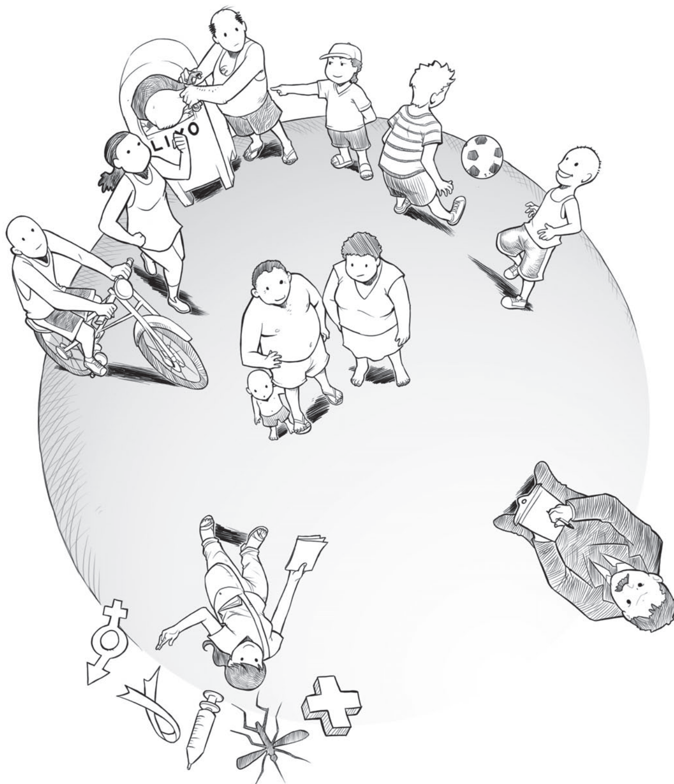
Ilustração: Danusko Campos