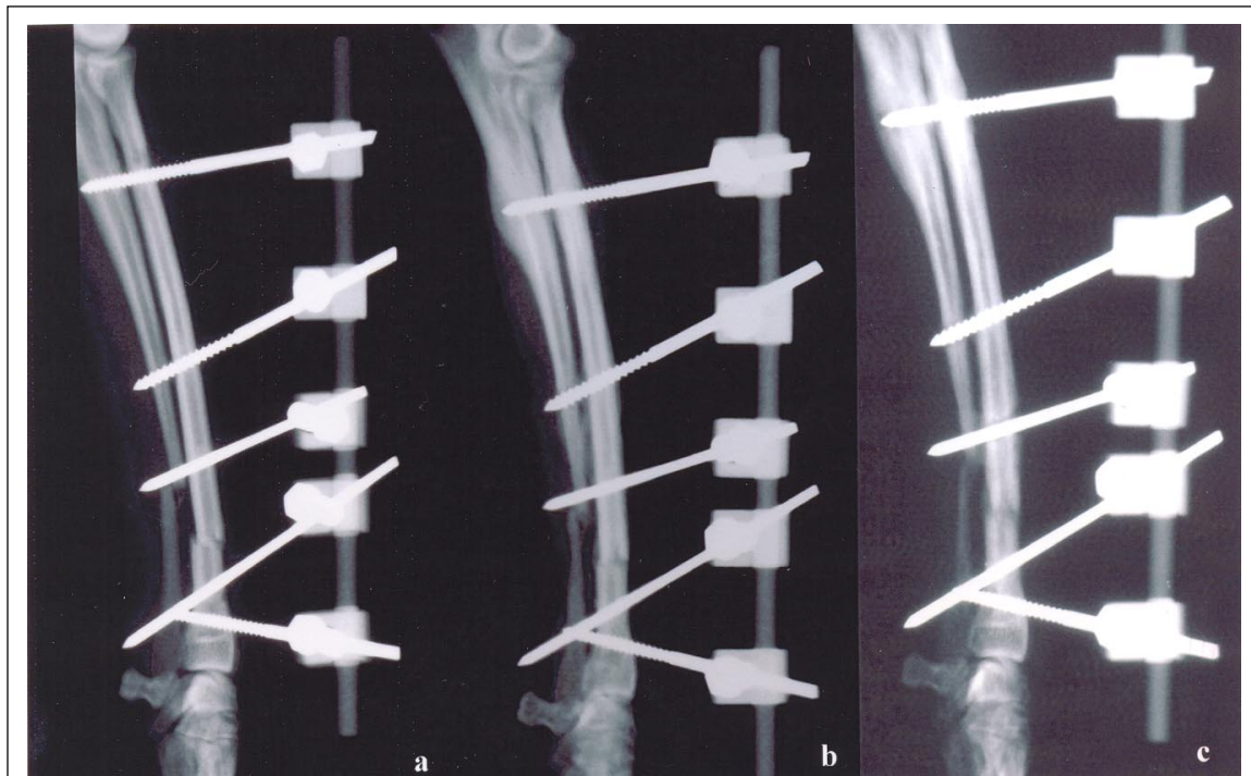
Figura 2 - Animal nº 1. (a) Imagem radiográfica em projeção médio-lateral de fratura transversa em terço distal de rádio e ulna em cão da raça Terrier Brasileiro, macho, um ano de idade, 6kg, estabilizada por osteossíntese com fixador externo tipo Ia e tratada com estimulação ultra-sônica; (b) aos 30 dias pós-operatórios, observa-se ponte cortical completa, com linha radiotransparente na falha entre os fragmentos (grau 5); (c) aos 60 dias pós-operatórios, observa-se ponte cortical completa, sem linha radiotransparente na falha entre os fragmentos (grau 6).

óssea mostraram-se reduzidos, em comparação aos dos animais do grupo controle (Tabela 1). Esses resultados sugerem que a associação da estimulação ultra-sônica aos procedimentos de osteossíntese acelera o processo de consolidação óssea.