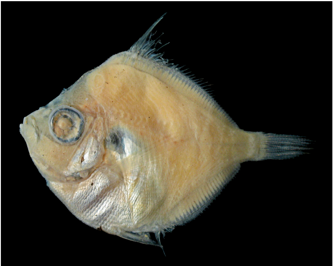
FIGURE 5: Antigonid combatia Berry & Rathjen, 1958, MZUSP 89230, Ceará, Fortaleza, Banco Canopus, 120 milhas ao largo do litoral (260 m de profundidade), 73,0 mm de comprimento total.

Comentários : são assinaladas mais duas espécies de Nezumia na costa brasileira: N. atlanticus (Parr) e N. suilla Marshall & Iwamoto, 1976 que ocorrem até a costa central do Brasil. Nezumia aequalis difere de N. atlanticus no focinho mais projetado em relação à vertical que passa pela sínfise mandibular, e de N. suilla na presença de oito a dez raios (contra seis ou sete) na nadadeira pélvica, e de escamas espinhosas acima da metade posterior da maxila. Foram encontradas algumas diferenças morfométricas entre os exemplares aqui examinados e informações da literatura; diferenças merísticas entre material do sul do Brasil e tais dados da literatura foram previamente apontadas por Mincarone et al. (2004), mas não é possível avaliar, com os dados disponíveis, o real significado dessas variações.