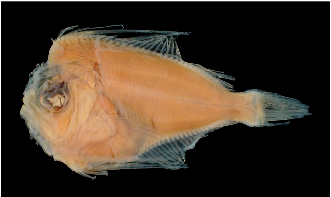
FIGURE 9: Caristius macropus (Bellotti, 1903), MZUSP 93287, 32°58'S 50°35'W, 99 m de profundidade, 47,1 mm de comprimento total.

Descrição : D. 34; A. 23; P. 18; rastros branquiais: 6+14. Altura do corpo 59,2% do CP, comprimento da cabeça 36,4%, distância pré-dorsal 14,6%, e distância pré-anal 50,0% do CP. Comprimento do focinho 17,0% do comprimento da cabeça, diâmetro orbital 39,1%, e comprimento da maxila superior 55,7% do comprimento da cabeça.