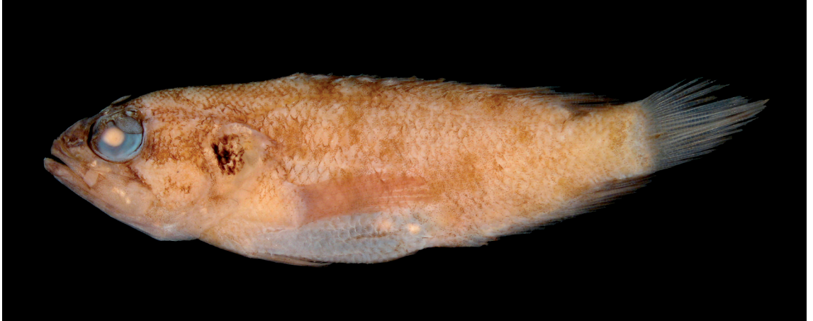
FIGURE 7: Pseudogramma gregoryi (Breder, 1923), MZUSP 89233, Ceará, Fortaleza, Banco Canopus, 120 milhas ao largo do litoral (260 m de profundidade), 32,9 mm de comprimento total.

a primeira ocorrência dessa espécie no Atlântico Sul ocidental.