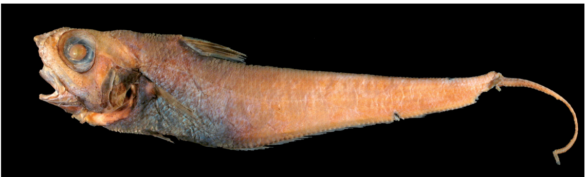
FIGURE 4: Nezumia aequalis (Günther, 1878), MZUSP 86723, 33°36'22"S 50°43'38"W (538 m de profundidade), exemplar danificado.

Material examinado: MZUSP 86723, 33°36'22"S 50°43'38"W, 538 m de profundidade, 23.ii.2002