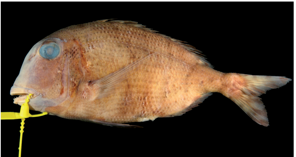
FIGURE 8: Calamus mu Randall & Caldwell, 1966, MZUSP 82206, Bahia, entre Itacaré e Valença, 220,0 mm de comprimento total.

Distribuição: espécie até então conhecida do sul da Flórida à Venezuela (Breder, 1927; Heemstra et al. ,