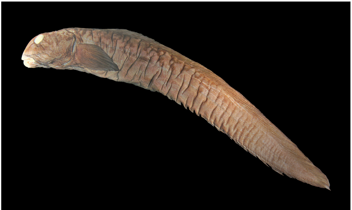
FIGURE 11: Notolycodes schmidti Gosztonyi, 1977, MZUSP 86685, Rio Grande do Sul, 34°30'38"S 51°49'04"W, 350,0 mm de comprimento total.

Material examinado: MZUSP 71380, 28°42'S 48°46'W, 54-56 m de profundidade, 17.viii.1970 (N. Oc. W. Besnard, sta. 1190) (1 ex.; 76,3 mm).