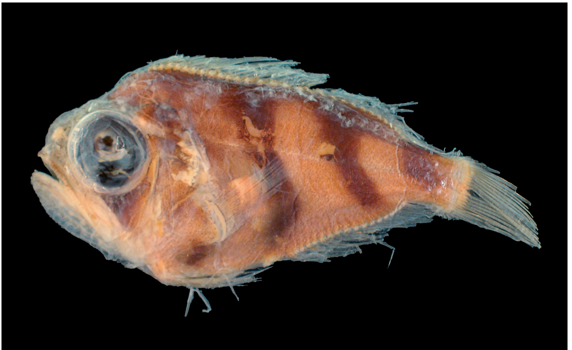
FIGURE 10: Caristius sp., MZUSP 86699, 26°19'49"S 45°57'00"W (600 m de profundidade), 53,0 mm de comprimento total.

Comentários: segundo registro de um representante da Família Caristiidae em águas brasileiras. Este exemplar é semelhante a Paracaristius maderensis (Maul, 1949), mas apresenta a extremidade do maxilar exposta, em vez de coberta pela série de ossos infraorbitais. Por sua vez, em uma ilustração dessa espécie (Marcus, 2005; Fig. F; p. 1543) a extremidade do maxilar aparece exposta. No entanto, tal figura foi baseada em um indivíduo muito menor que o que nós examinamos (18,0 mm de comprimento). Os representantes de Caristiidae passam por grandes alterações durante o