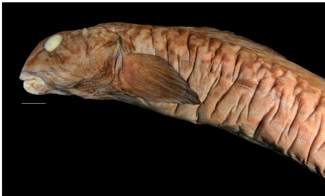
FIGURE 12: Notolycodes schmidti Gosztonyi, 1977, MZUSP 86685, detalhe da região anterior do corpo. Escala: 20,0 mm.

mento do focinho 38,6% do comprimento da cabeça, comprimento do olho 26,7%, comprimento da peitoral 53,0%, base da dorsal 31,1% e base da anal 28,8% do comprimento cefálico.