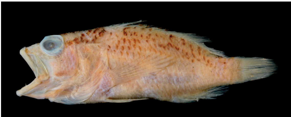
FIGURE 6: Plectranthias garrupellus Robins & Starck, 1961, MZUSP 84600, 23°30'S 42°27'W (134-136 m de profundidade), 97,0 mm de comprimento total.

Distribuição: espécie até então conhecida da região entre a costa da Carolina do Norte à Flórida, e no Caribe (Robins & Starck, 1961; Randall, 1980; Heemstra et al. , 2003). Os exemplares aqui citados representam