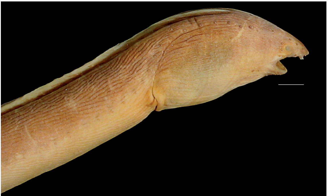
FIGURE 2: Bascanichthys paulensis Storey, 1939, MZUSP 18959, São Paulo, Itanhaém, 696,6 mm de comprimento total. Detalhe da região anterior do corpo. Escala: 8,0 mm.

Comentários: Koike & Guedes (1981) assinalaram Bascanichthys teres , atualmente considerada sinônima a B. scuticaris (Goode & Bean, 1880), nos arrecifes de Piedade, Pernambuco. Como, de acordo com o estudo mais extenso a respeito desse gênero (McCosker et al. , 1989), essa espécie não ocorre ao sul do Golfo