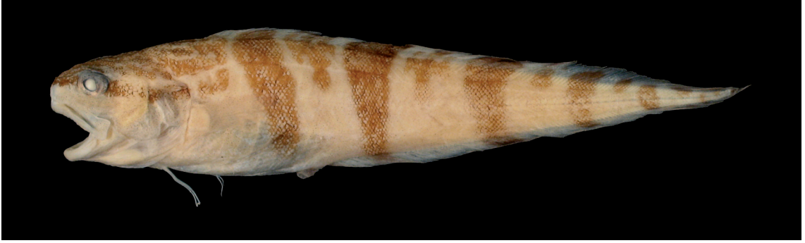
FIGURE 3: Neobythites braziliensis Nielsen, 1999, MZUSP 89220. Ceará, Fortaleza, Banco Canopus, 120 milhas ao largo do litoral (260 m de profundidade), 131,1 mm de comprimento total.

do México, é provável que o exemplar citado por esses autores seja na verdade B. paulensis .