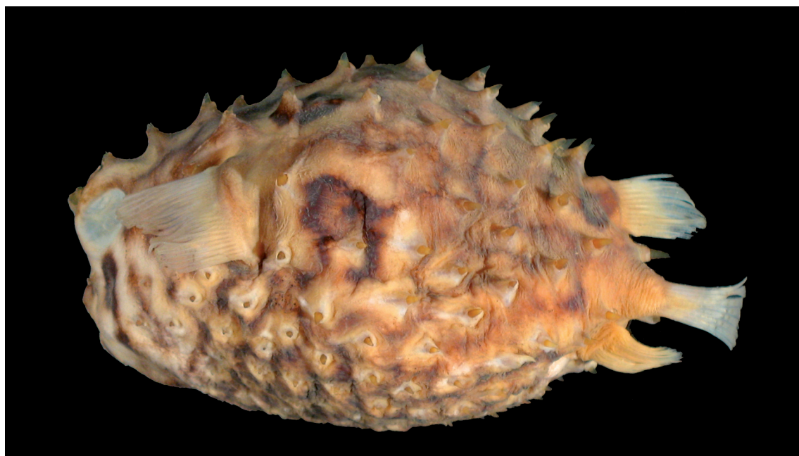
FIGURE 13: Chilomycterus antillarum (Jordan & Rutter, 1897), MZUSP 71380, 28°42'S 48°46'W, 76,3 mm de comprimento total.