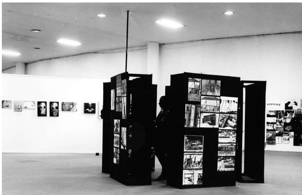
Figura 8 – Exposição O fotógrafo desconhecido , 1972. Museu de Arte Contemporânea, Universidade de São Paulo.