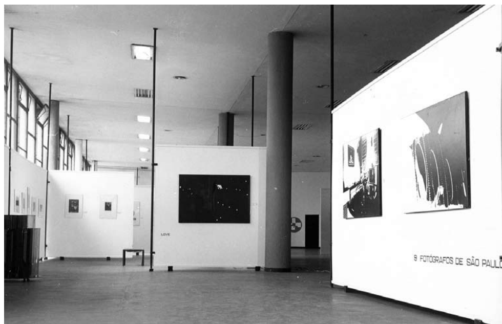
Figura 6 – Exposição 9 Fotografos de São Paulo , 1971. Museu de Arte Contemporânea, Universidade de São Paulo.

103. Para o acervo do MAC, foram adquiridas fotografias