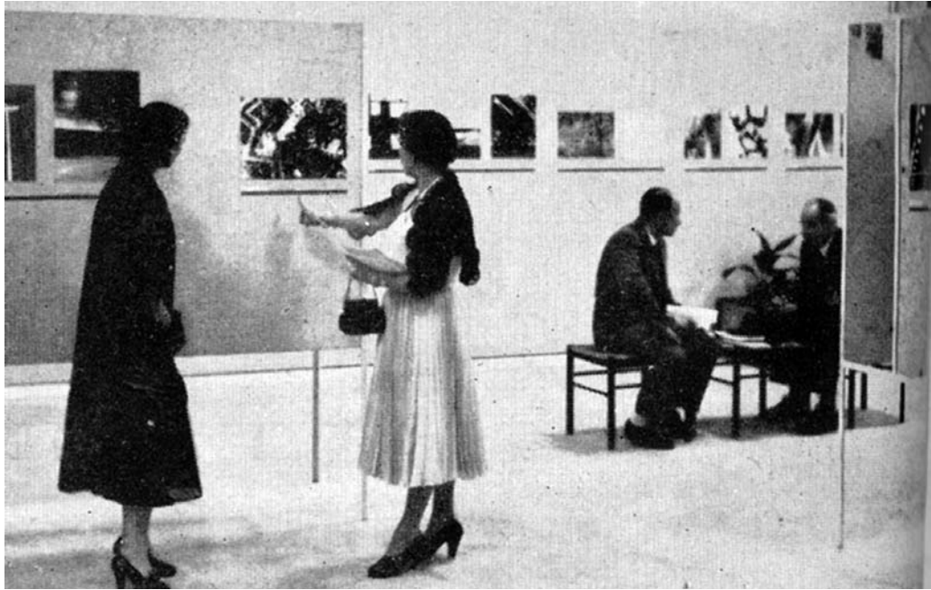
Figuras 2 – Sala Especial de Fotografia do Foto Cine Clube Bandeirante. II Bienal de São Paulo, 1953. Boletim Foto Cine , São Paulo, n.87, fev-mar.1954, p.12. Arquivo Foto Cine Clube Bandeirante-SP.