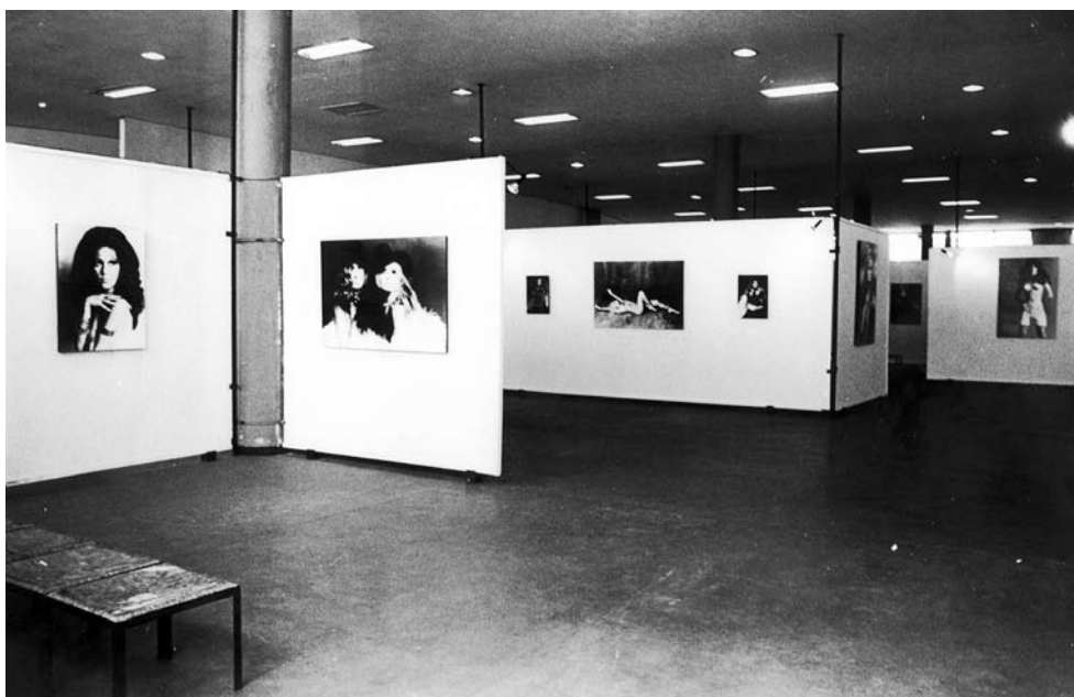
Figura 4 – Exposição Beleza de Pedra, 1969. Museu de Arte Contemporânea, Universidade de São Paulo.