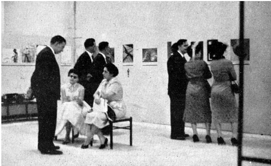
Figuras 3 – Sala Especial de Fotografia do Foto Cine Clube Bandeirante. II Bienal de São Paulo, 1953. Boletim Foto Cine , São Paulo, n.87, fev-mar.1954, p.12.