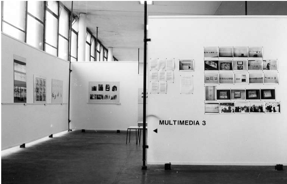
Figura 11 – Exposição Multimedia III, 1976. Museu de Arte Contemporânea da Universidade de São Paulo.