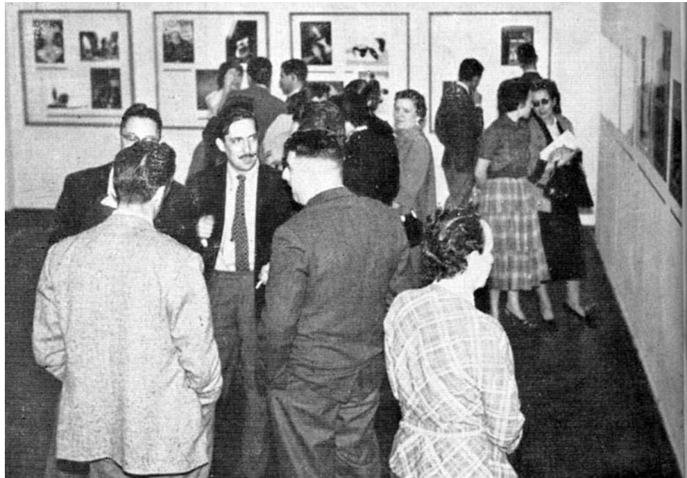
Figura 1 – Exposição Otto Steinert e seus discípulos, 1955. Museu de Arte Moderna de São Paulo. Boletim Foto Cine, São Paulo, n.97, ago-out. 1955.