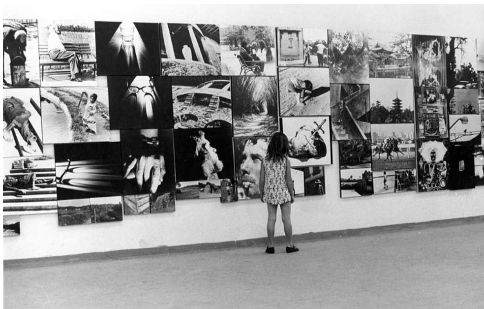
Figura 7 – Exposição O fotógrafo desconhecido, 1972. Museu de Arte Contemporânea, Universidade de São Paulo.