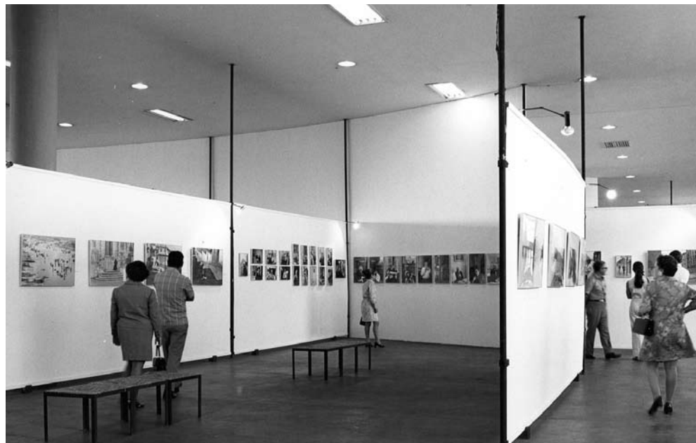
Figura 5 – Exposição Cartier-Bresson: fotografias recentes, 1970. Museu de Arte Contemporânea, Universidade de São Paulo.