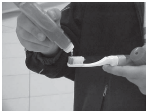
Figura 3. Técnica da gota.

menta tipo chave de fenda (kit 2), ou armazenada em porta-lápis ou garrafa de refrigerante cortada ao meio, exposta a todo tipo de contaminação (kit 4). Muito menos dentro de saquinhos ou embalagens fechados sem circulação de ar (kits 1 e 3), transformando as escovas em verdadeiros depósitos de microrganismos. Em adição, programas baseados unicamente na distribuição de escovas comprometem a relação custo-benefício, visto que as mesmas são acondicionadas de forma inadequada, muitas vezes perdidas, comprometendo a higiene bucal diária na escola.