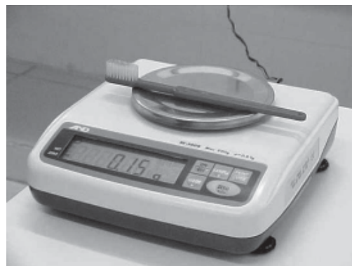
Figura 1. Balança portátil de precisão.

A escova dentária, instrumento indispensável para a manutenção da saúde, deve ser armazenada em local adequado, e não como ferr-