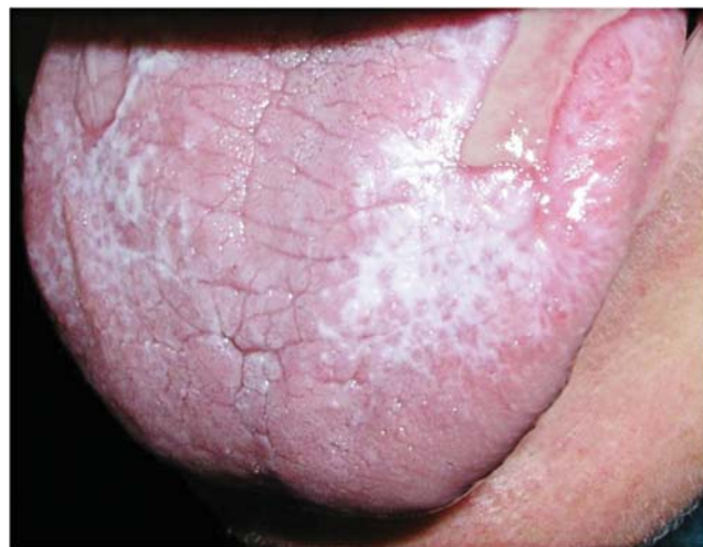
FIGURA 4: Líquen plano erosivo - lesão ulcerada em dorso de língua circundada por estrias reticulares

No estudo de Di Fede et al., foi observada a presença de líquen plano vaginal em 88% das 41 pacientes que apresentavam LPO. Curiosamente,