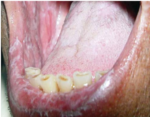
FIGURA 1: Líquen plano reticular - aspecto reticular em lábios e mucosa jugal

ra de duas formas clínicas, como a presença de estrias brancas características do tipo reticular circundada por uma área eritematosa. 14