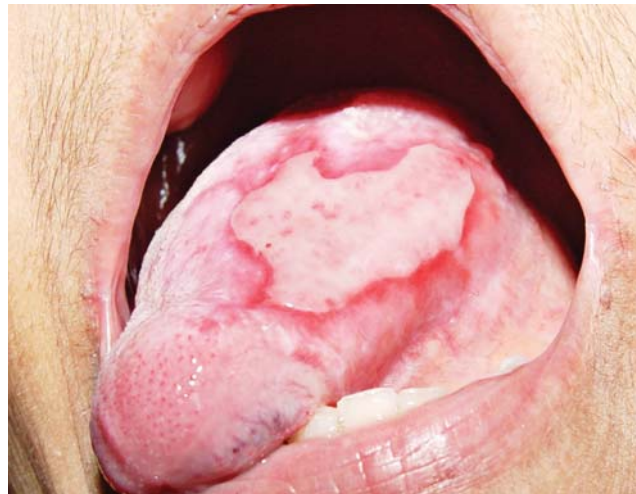
FIGURA 3: Líquen plano erosivo - lesão ulcerada em bordo lateral de língua com bordos eritematosos