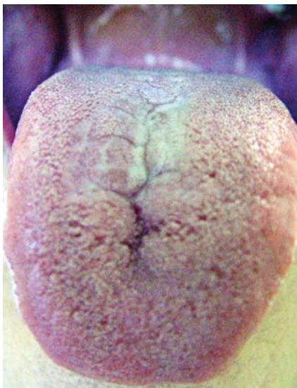
FIGURA 2: Líquen plano reticular - aspecto reticular de dorso de língua

Bolhosa: O tipo bolhoso é a forma clínica mais incomum e apresenta bolhas que aumentam de tamanho e tendem à ruptura, deixando a superfície ulcerada e dolorosa. A periferia da lesão é, em geral, circundada por estrias finas e queratinizadas. 3,16