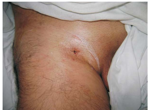
Figura 3 - Aspecto final no primeiro dia pós-operatório após retirada do curativo inguinal; ausência de hematoma ou mesmo equimose

com hemorragia, dissecação arterial, infecção da sutura, formação de pseudoaneurisma, fistula artério-venosa são complicações possíveis da técnica 4 . Em nossa casuística, não houve complicações relacionadas ao fechamento percutâneo, provavelmente devido à adequada seleção dos pacientes.