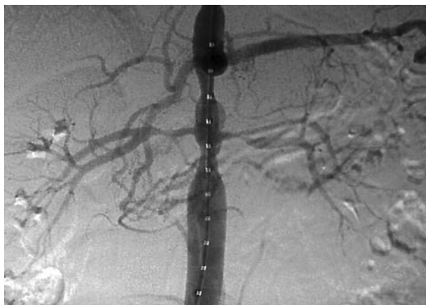
Figura 3 - Arteriografia com subtração digital mostrando a estenose segmentar na aorta toracoabdominal

(Figura 3). O gradiente pressórico sistólico translesional aórtico (proximal ao nível do diafragma e distal ao nível da bifurcação das artérias ilíacas) foi de 50 mmHg. Realizou-se a heparinização sistêmica na dose de 100 UI/kg seguida da angioplastia da ATA com cateter-balão 10 x 40 mm (Ultrathin Diamond, Boston Scientific, Natick, EUA) (Figura 4). O tempo de insuflação do balão foi de 3 minutos com pressão máxima de 15 atm. A angiografia pós-tratamento evidenciou melhora da lesão aórtica e opa-