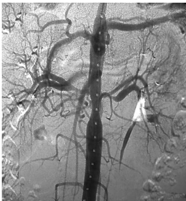
Figura 4 - Arteriografia com subtração digital pós-angioplastia com balão mostrando o tratamento da estenose da aorta toracoabdominal com opacificação da artéria mesentérica superior

cificação da AMS. Observou-se queda do gradiente pressórico translesional de 50 para 10 mmHg, demonstrando o tratamento efetivo da lesão aórtica. As AR não foram tratadas. Na evolução pós-operatória imediata obteve-se queda dos níveis pressóricos nos membros superiores (PA 130 x 80 mmHg) e diminuição da medicação anti-hipertensiva (atenolol 50 mg/dia e amlodipina 5 mg/dia). A paciente manteve-se assintomática, obtendo alta hospitalar no terceiro dia em uso de ácido acetilsalicílico (AAS) 200 mg/dia e de clopidogrel 75 mg/dia, este último mantido por seis meses, além do uso das medicações habituais anti-hipertensivas e imunossupressoras. Atualmente encontra-se no 10º mês pós-operatório, com os seus níveis pressóricos controlados somente com atenolol 25 mg/dia e em uso de AAS 200 mg/dia, prednisona 5 mg - 2/2 dias e metotrexate 25 mg/semana.