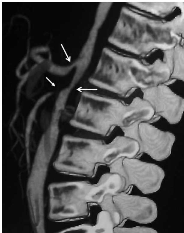
Figura 1 - Reconstrução angiotomográfica da aorta toracoabdominal mostrando estenose grave da aorta e da artéria mesentérica superior e estenose moderada do tronco celiaco.

trou-se leve sedação pela equipe de anestesia, não havendo necessidade de anestesia geral. Realizou-se aortografia com cateter pigtail centimetrado posicionada na aorta torácica distal, confirmando-se a lesão estenótica na ATA, a não opacificação da AMS, estenose moderada das AR e estenose moderada da aorta abdominal infrarrenal (AAIR)