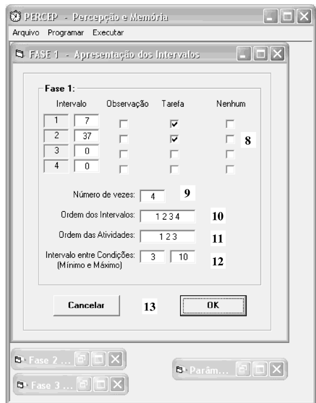
Figura 2. Tela de configurações da Fase 1 – Apresentação dos Intervalos – do programa "PERCEP"; os números indicam itens cuja função é detalhada no corpo do texto

7. Botões OK e Cancelar : o botão "Cancelar" fecha a respectiva tela; o botão "Ok" registra e armazena as configurações determinadas.