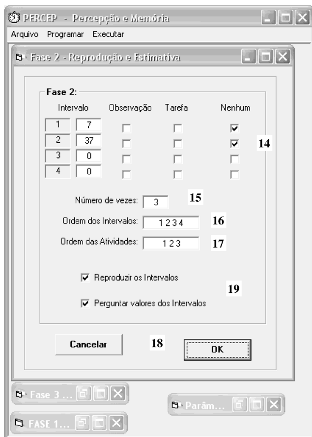
Figura 3. Tela de configurações da Fase 2 – Reprodução e Estimativa – do programa “PERCEP”; os números indicam itens cuja função é detalhada no corpo do texto

rer, o participante deverá realizar a atividade determinada que lhe foi previamente indicada pelo pesquisador. Além disso, o participante é instruído a parar sua atividade e se preparar para as próximas instruções quando, na tela do computador, aparecer escrito “DESCANSE”.