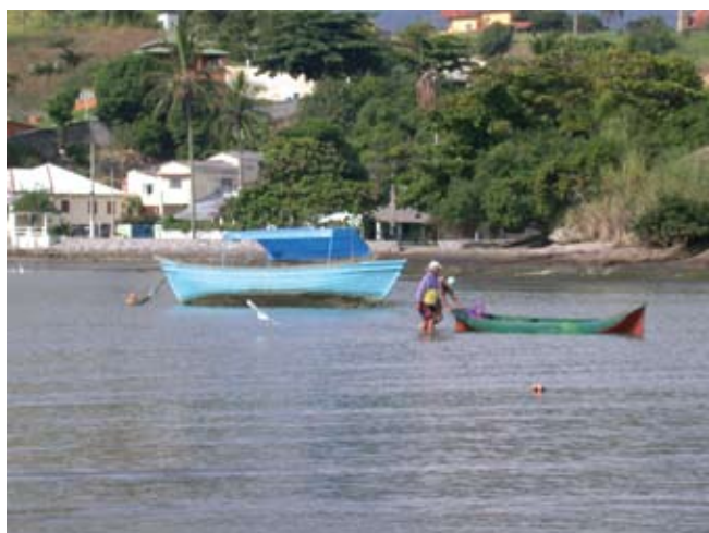
Figura 20. Baía do Araçá: pescadores locais retornando de uma pescaria na baía. Foto: S.A. Nallin (05/2009).

A composição da fauna e flora diz muito a respeito do grau de estabilidade ou perturbação de um ambiente. Muitas espécies só ocorrem em locais mais estáveis, enquanto outras, oportunistas, aproveitam espaços vazios disponibilizados na comunidade, após perturbações de diversas origens. As espécies oportunistas frequentemente indicam o estado de perturbação dos ambientes. Comunidades bentônicas, organismos que vivem sobre o substrato ou enterrados, têm sido utilizadas como uma das principais ferramentas para avaliação da qualidade ambiental.