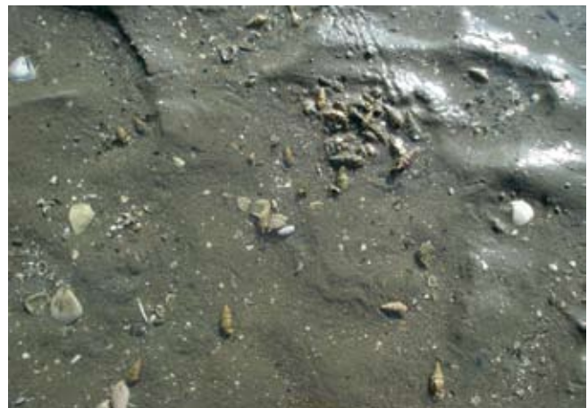
Figura 18. Baía do Araçá: gastrópode Cerithium atratum na região entremarés. Foto: A.C.Z. Amaral (07/2009).

Figure 15. Araçá Bay: burrow opening of the crab Uca , intertidal zone, mangrove vegetation near Pernambuco Island. Photo: A.C.Z. Amaral (07/2009).