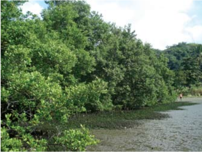
Figura 7. Baía do Araçá: vegetação do núcleo de manguezal localizado na parte superior da região entremarés. Foto: A.C.Z. Amaral (07/2009).

Figure 7. Araçá Bay: mangrove vegetation, high intertidal zone. Photo: A.C.Z. Amaral (07/2009).