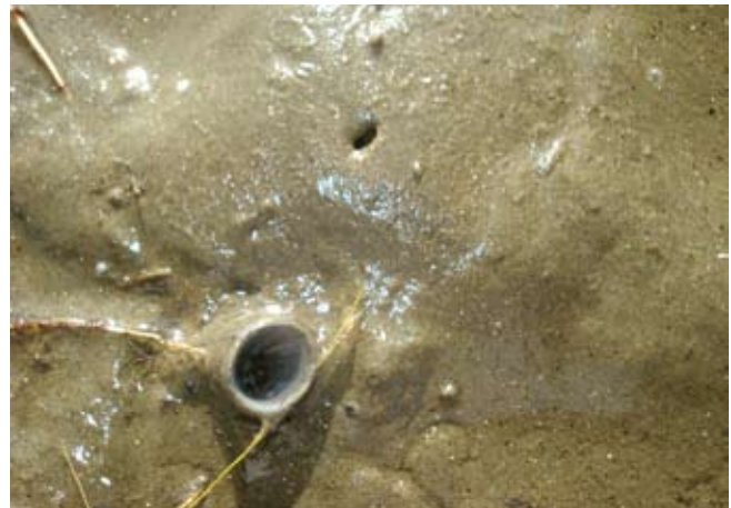
Figura 17. Baía do Araçá: tubo do poliqueta Diopatra aciculata em sedimento areno-lamoso na região entremarés. Foto: A.C.Z. Amaral (07/2009).

Figure 14. Araçá Bay: aggregates of fecal material on the surface of muddy sand bed produced by the polychaete Laeonereis culveri . Photo: A.C.Z. Amaral (07/2009).