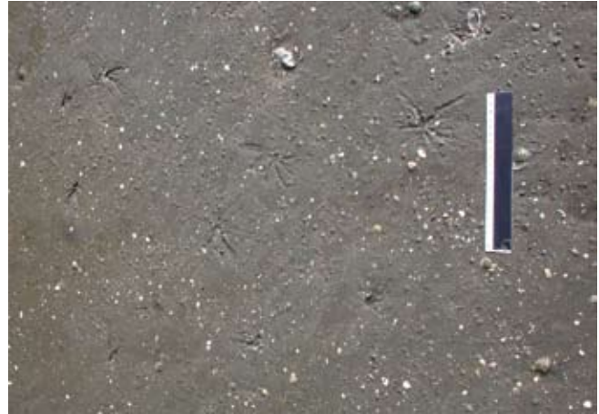
Figura 16. Baía do Araçá: marcas do bivalve Macoma em sedimento areno-lamoso na região entremarés. Foto: S.A. Nallin (05/2009).

Figure 13. Araçá Bay: small tubes of the crustacean Kalliapseudes , and sinuous trail marks of the gastropod Olivella minuta in muddy sand flat, intertidal zone. Photo: A.C.Z. Amaral (07/2009).