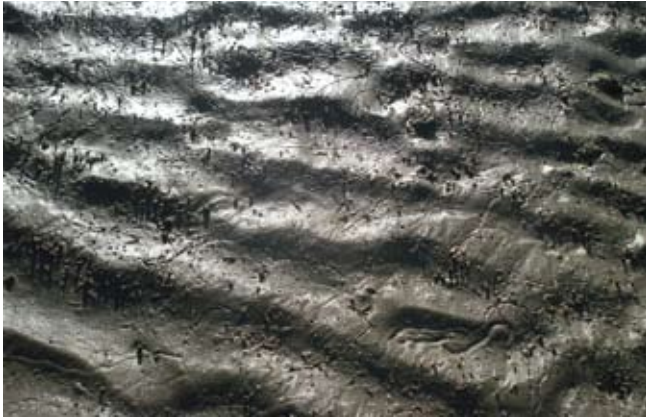
Figura 13. Baía do Araçá: pequenos tubos do crustáceo Kalliapseudes e marcas do gastrópode Olivella minuta em sedimento areno-lamoso na região entremarés. Foto: A.C.Z. Amaral (07/2009).

Figure 13. Araçá Bay: small tubes of the crustacean Kalliapseudes , and sinuous trail marks of the gastropod Olivella minuta in muddy sand flat, intertidal zone. Photo: A.C.Z. Amaral (07/2009).