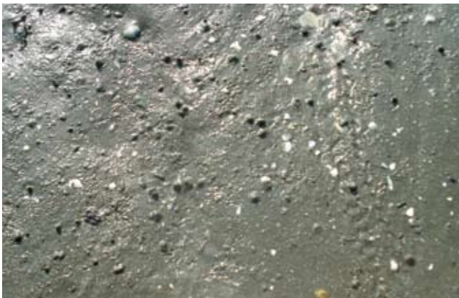
Figura 14. Baía do Araçá: dejetos na superfície do sedimento areno-lamoso que caracteriza a presença do poliqueta Laeonereis culveri . Foto: A.C.Z. Amaral (07/2009).

Figure 16. Araçá Bay: signs of the clam Macoma in muddy sand flat, intertidal zone. Photo: S.A. Nallin (05/2009).