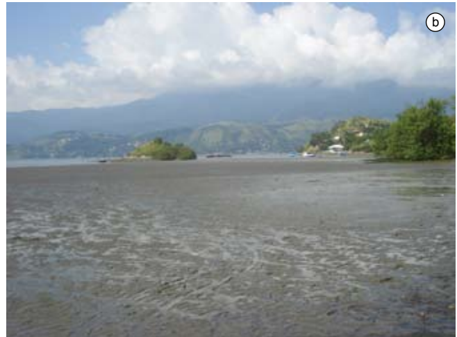
Figura 2. a-b) Baía do Araçá: região entremarés, fundo areno-lamoso.

Figure 2. a-b) Araçá Bay: intertidal zone, muddy sand flat.