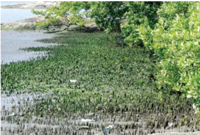
Figura 8. Baía do Araçá: detalhe do núcleo de manguezal localizado na parte superior da região entremarés. (07/2009)

Figure 7. Araçá Bay: mangrove vegetation, high intertidal zone. (07/2009).