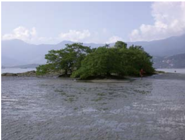
Figura 3. Baía do Araçá: vista geral do núcleo de manguezal localizado nas proximidades da Ilha Pernambuco.

Figure 2. a-b) Araçá Bay: intertidal zone, muddy sand flat.