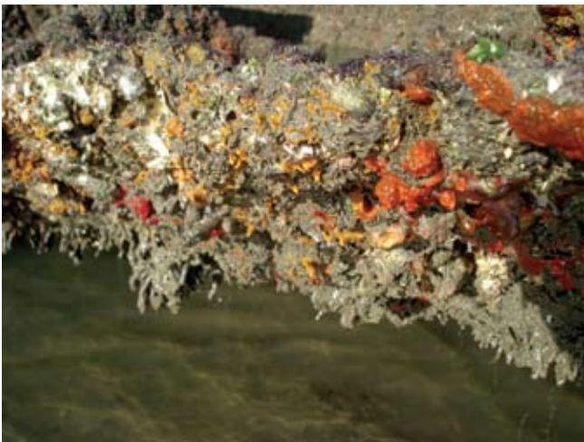
Figura 9. Baía do Araçá: costão rochoso da Ilha Pernambuco, zona inferior da região entremarés. Foto: A.C.Z. Amaral (07/2009).

Figure 8. Araçá Bay: detail of the mangrove vegetation, high intertidal zone. Photo A.E. Migotto (07/2009).