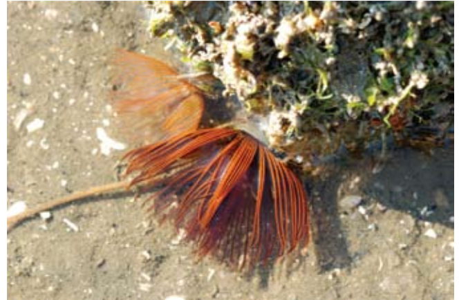
Figura 10. Baía do Araçá: costão rochoso da Ilha Pernambuco, em evidência poliquetas sabelídeos Branchiomma luctuosum . (07/2009).

Figure 9. Araçá Bay: low intertidal rocky shore, Pernambuco Island. (07/2009).