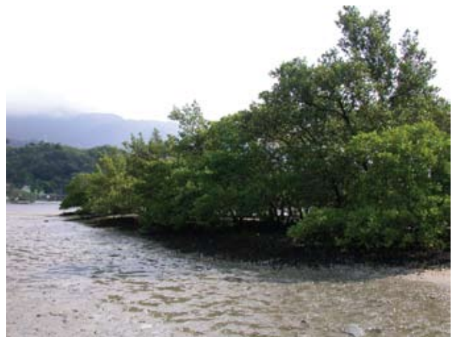
Figura 6. Baía do Araçá: núcleo de manguezal localizado na parte superior da região entremarés. Foto: S.A. Nallin (05/2009).

Figure 4. Araçá Bay: mangrove vegetation located near Pernambuco Island. Photo: S.A. Nallin (05/2009).