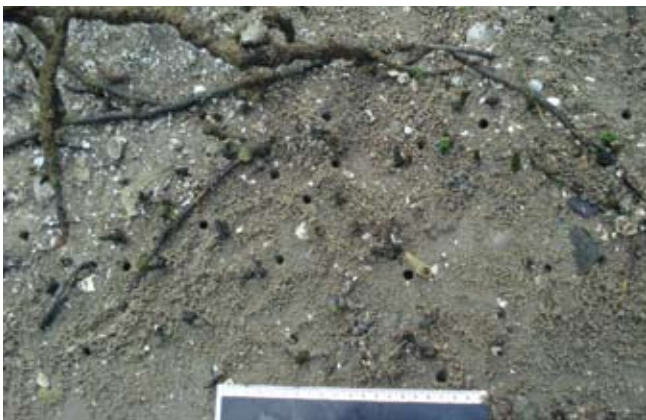
Figura 15. Baía do Araçá: aberturas de galerias do crustáceo Uca , região entremarés, núcleo de manguezal localizado próximo à Ilha Pernambuco. Foto: A.C.Z. Amaral (07/2009).

Figure 17. Araçá Bay: tube of the polychaete Diopatra aciculata in muddy sand flat, intertidal zone. Photo: A.C.Z. Amaral (07/2009).