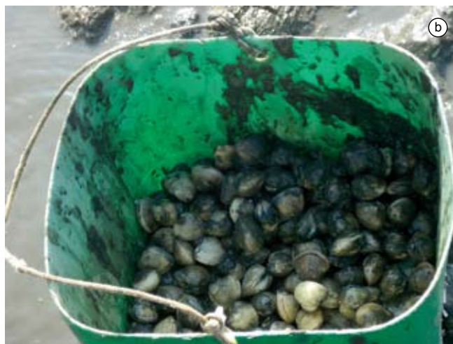
Figura 19. Baía do Araçá: a) caiçara coletando o berbigão Anomalocardia brasiliana em sedimento areno-lamoso na região entremarés; b) resultado da coleta de A. brasiliana em poucas horas de trabalho. Foto: A.C.Z. Amaral (07/2009).