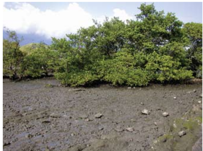
Figura 5. Baía do Araçá: interior do núcleo de manguezal localizado nas proximidades da Ilha Pernambuco. Foto: S.A. Nallin (05/2009).

Figure 3. Araçá Bay: general view of mangrove vegetation located near Pernambuco Island. Photo: S.A. Nallin (05/2009).