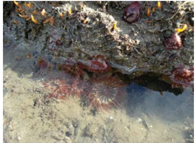
Figura 11. Baía do Araçá: costão rochoso da Ilha Pernambuco, em evidência anêmonas-do-mar Anemonia sargassensis . Foto: A.C.Z. Amaral (07/2009).

Figure 10. Araçá Bay: rocky shore of Pernambuco Island, showing Sabellid polychaetes Branchiomma luctuosum . Photo: A.E. Migotto (07/2009).