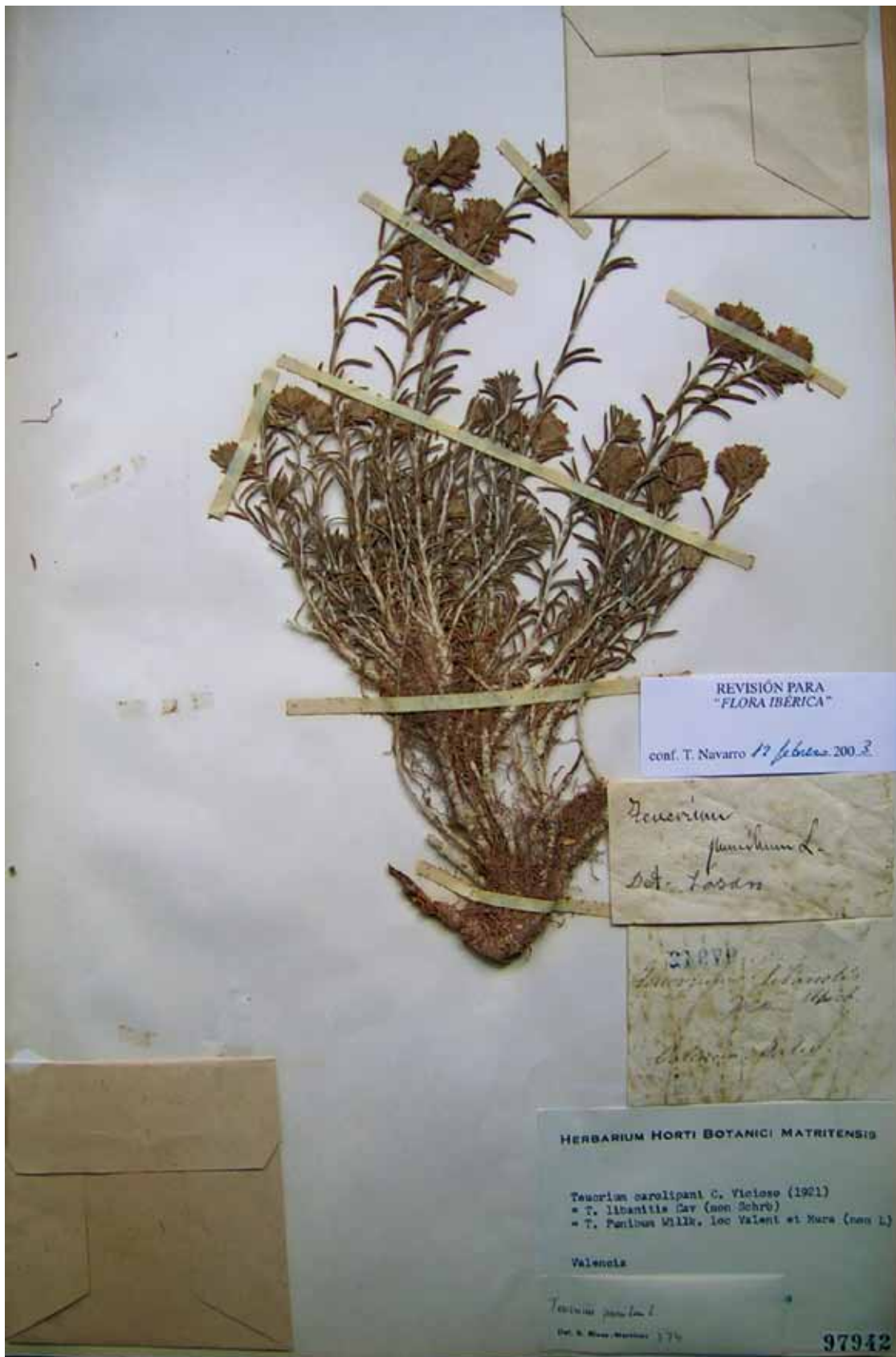
Figura 2. Pliego recolectado por Juan Isern, testigo de su visita por tierras valencianas. Teucrium carolipau C. Vicioso ex Pau, MA 97942.