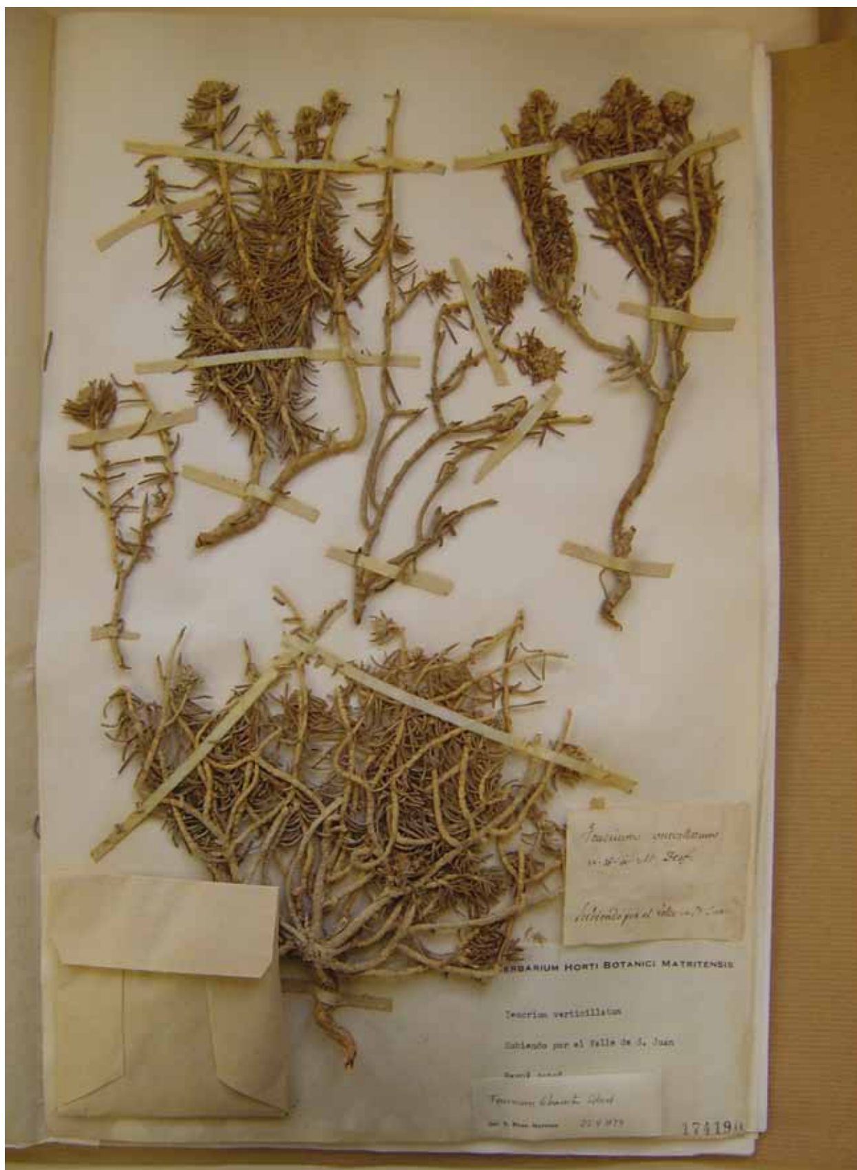
Figura 3. Teucrium libanitis Schreb., MA 174190.