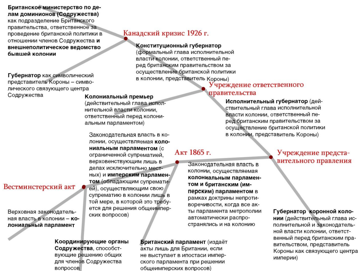
Рисунок 1. Динамика эволюции административно-политических институтов «белой» части Второй Британской империи

Парадигма российского имперского мышления подразумевает, что имперское политическое пространство может существовать в двух стабильных состояниях: централизованное, вертикально выстроенное унифицированное государство (собственно империя) или империя дезинтегрированная (комплекс независимых национальных государств). Всякое прочее состояние воспринимается как временное, переходное – хаотичное. Возможно, в применении к Российской империи это верно. Однако опыт Британской империи подталкивает к мысли, привычной скорее для современного естествознания, – хаос может быть стационарным. Становление и агония могут быть нормой жизни, неустойчивое (в «космическом масштабе») состояние может быть длительным в масштабе нескольких поколений людей. Вторая Британская империя была обречённой империей, она клонилась к упадку, но процесс этот столь растянулся, что приобрёл характер нормального существования безотносительно к конечному итогу.