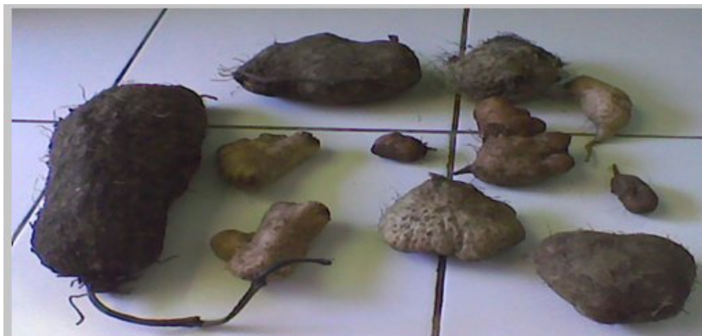
Gambar 1. Variasi bentuk dan ukuran umbi uwi koleksi

Penampilan fisik umbi uwi yang dikoleksi sangat bervariasi, baik ukuran, bentuk, dan warna daging umbi sesuai dengan jenisnya (Gambar 1). Ukuran umbi ada yang sangat besar, hingga mencapai lebih dari 3 kg umbi -1 , tetapi ada juga yang kecil hanya sekitar 100 g umbi -1 . Bentuk umbi ada yang tidak beraturan, lonjong, hingga bulat. Daging umbi ada yang berwarna putih, kuning kecokelatan, hingga ungu. Uwi yang biasa disebut uwi kelapa, sego, atau uwi putih memiliki umbi tunggal, berbentuk tidak beraturan dengan ukuran yang cenderung besar, daging umbi warna putih kecokelatan dengan warna kulit kuning kecokelatan hingga ungu kehitaman. Sedangkan jenis uwi yang serupa uwi kelapa tetapi dengan kulit dan daging umbi warna ungu dikenal dengan nama daerah uwi senggani. Uwi jenis ini termasuk dalam spesies Dioscorea alata (French, 2006).