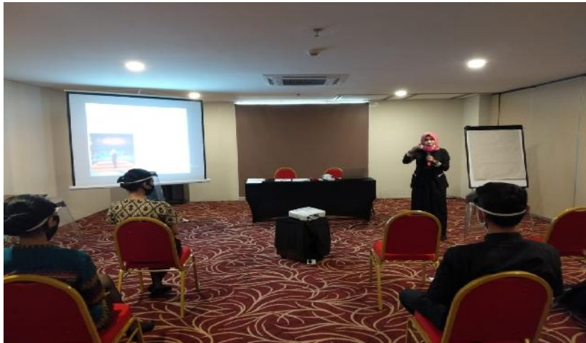
Gambar 1. Dokumentasi Kegiatan Pelatihan Penerapan Protokol Kesehatan di Hotel

tersebut akan diperiksa ulang suhu tubuhnya dan apabila suhu tubuh belum turun karyawan tersebut tidak boleh bekerja. Bagi karyawan yang baru kembali dari perjalanan dinas ke negara atau daerah terjangkit Covid-19. Karyawan wajib melakukan karantina mandiri selama 14 hari. Karyawan melaksanakan pola hidup sehat seperti cuci tangan dengan sabun, etika batuk, olahraga, makan makanan dengan gizi seimbang. Karyawan mencuci tangan dengan sabun atau hand sanitizer sebelum dan sesudah masuk ruang ganti dan ruang makan. Karyawan masuk ruang ganti dan ruang makan diatur secara bergantian. Menghindari kontak fisik dengan karyawan lain atau menjaga jarak minimal 1 meter. Memastikan kondisi ruang ganti dan ruang makan tetap kering setelah digunakan. Karyawan menggunakan toilet dan menjaga agar tetap higienis, bersih, kering, dan tidak bau setelah digunakan. Tidak menggunakan alat makan secara bersama-sama. Tidak berbagi makanan dan minuman dengan orang lain. Segera meninggalkan ruangan setelah selesai beraktifitas diruang ganti dan ruang makan karyawan.