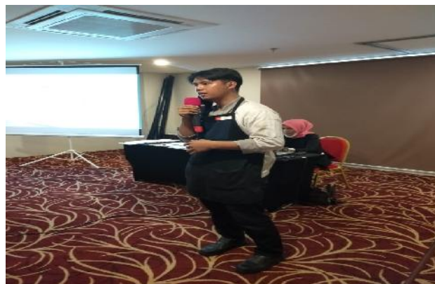
Gambar 2. Dokumentasi Sesi Tanya Jawab

Secara keseluruhan pelatihan ini berjalan lancar. Peserta pelatihan menunjukkan antusiasme dalam mengikuti kegiatan ini. Peserta secara aktif berdiskusi untuk mendapatkan gambaran mengenai penerapan protokol kesehatan saat mereka nanti akan berhadapan langsung dengan tamu. Setelah pelatihan selesai peserta diharapkan mampu menerapkan penerapan protokol kesehatan yang sudah disampaikan dengan baik