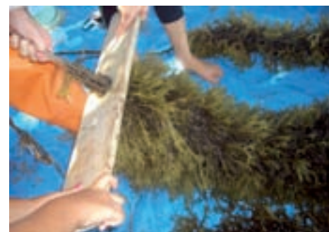
Roodwieren zoals deze Kappaphycus levert carrageen, een stof die net als agaragar de viscositeit van eetwaar en tandpasta verhoogt ( www.seaweed.ie )